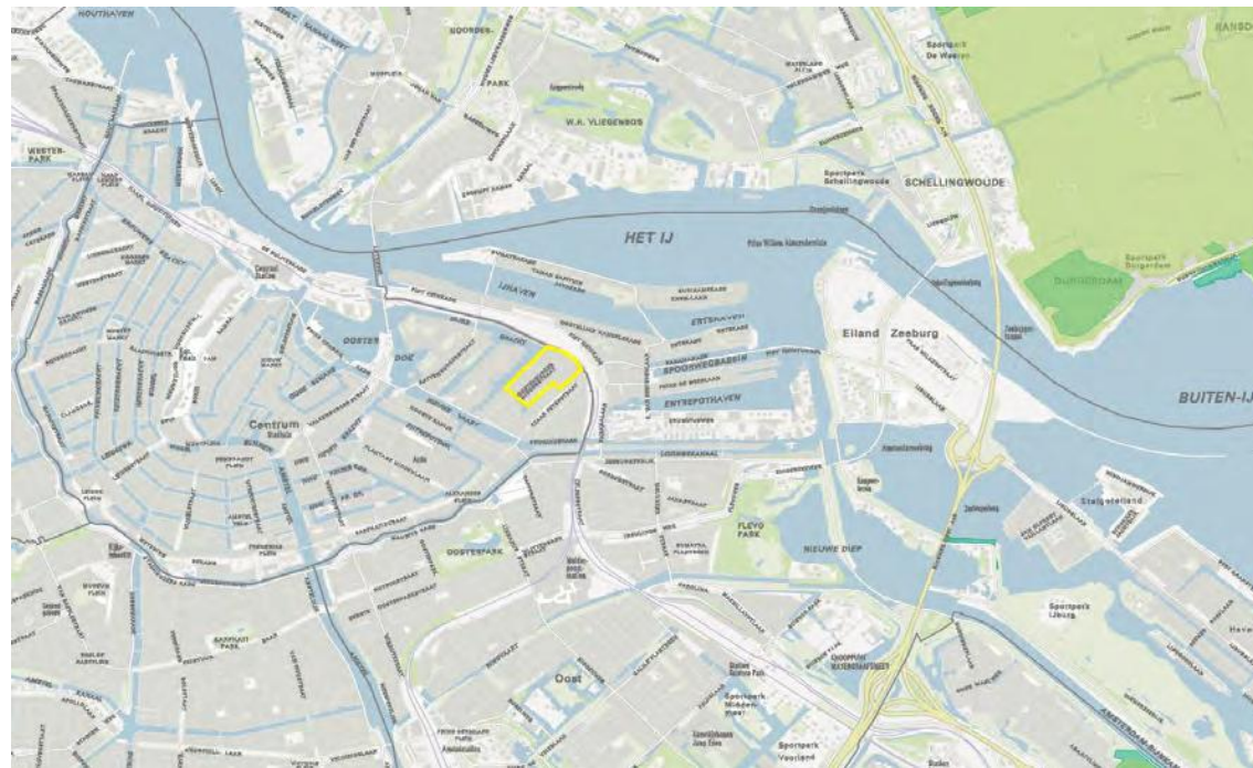
Ligging van de Natuurnetwerk Nederland.