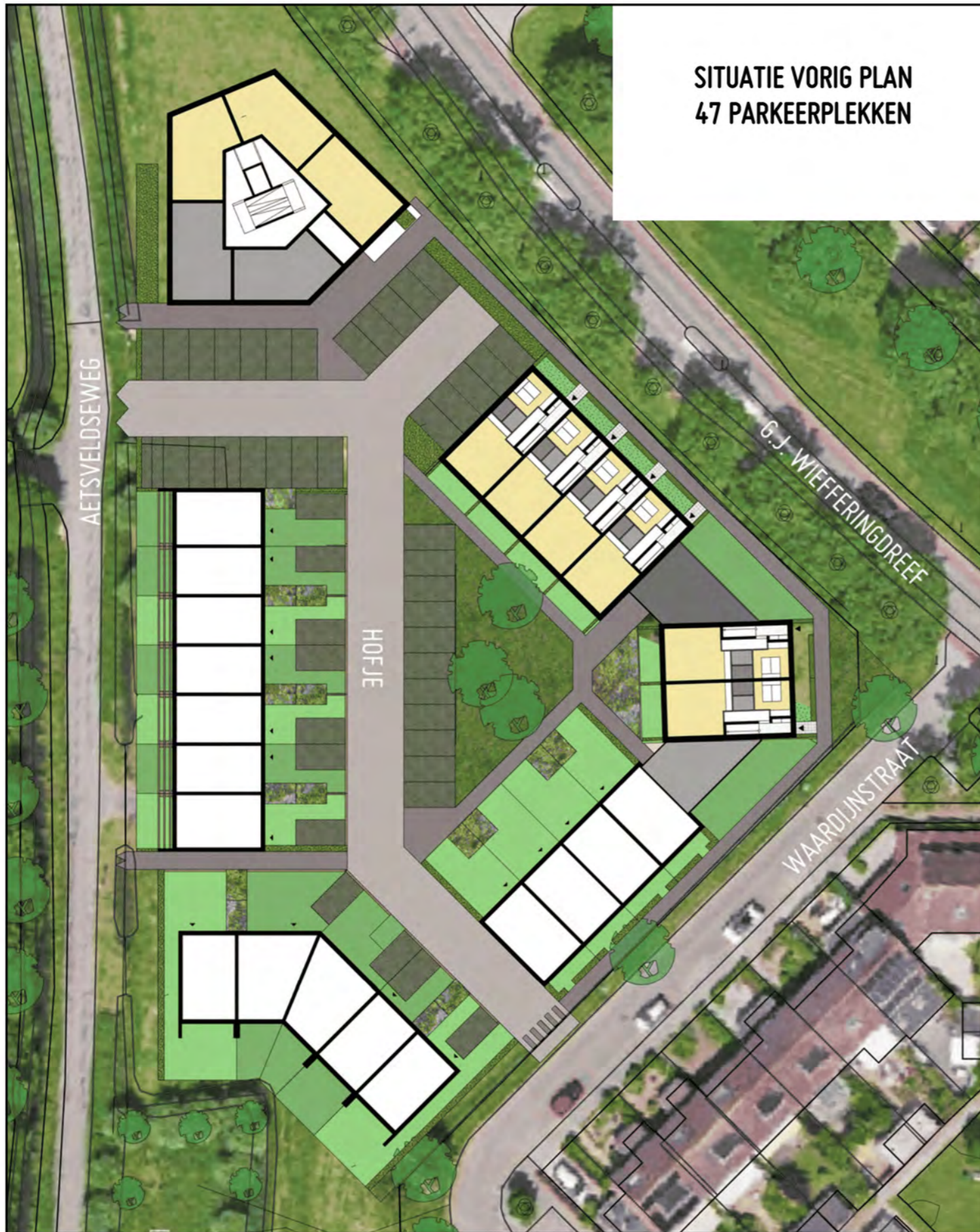
SITUATIE VORIG PLAN 47 PARKEERPLEKKEN