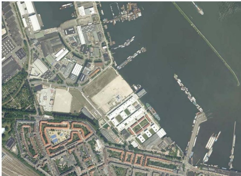
Figuur 1: Huidige situatie plangebied Houthaven

In figuur 1 is de huidige inrichting van de Houthaven weergegeven en figuur 2 laat de toekomstige inrichting van De Houthaven zien. Het gaat om maximaal 2.250 woningen en maximaal 90.000 m 2 oppervlak niet-wonen. De wijk zal bestaan uit zeven eilanden. Op het vasteland aan de westzijde van het gebied komt een deelgebied met bedrijfsruimte en een groot aandeel woningen. In het plan zijn ook steigers voor woonschepen, oud-binnenvaartschepen, een locatie voor het watersportcentrum Spaarndammerbuurt en het drijvende ateliergebouw de Bonte Zwaan opgenomen. Ten oosten van de eilanden zal op de kop van de pontsteiger een groot gebouw worden gerealiseerd. Hierin komen maximaal 250 woningen en één publieksvoorziening met een maximaal oppervlak van 2.000 m 2 . De weg voor het doorgaande verkeer komt straks in een ondergrondse tunnel onder aan de Spaarndamerdijk te liggen. Op de dijk zelf blijft een parallelweg voor het buurtverkeer en de bus liggen. Op het tunneldak is een groengebied gepland, een zogenaamde groene zoom, voor zowel de bewoners van de Spaarndammerbuurt als van de eilanden. Vanuit de bestaande buurt komen er door het groengebied fiets- en voetgangersbruggen naar het gebied. Voor een gedetailleerde beschrijving van het plan wordt verwezen naar het Stedenbouwkundig Plan De Houthaven uit 2006 en de aanvulling daarop.