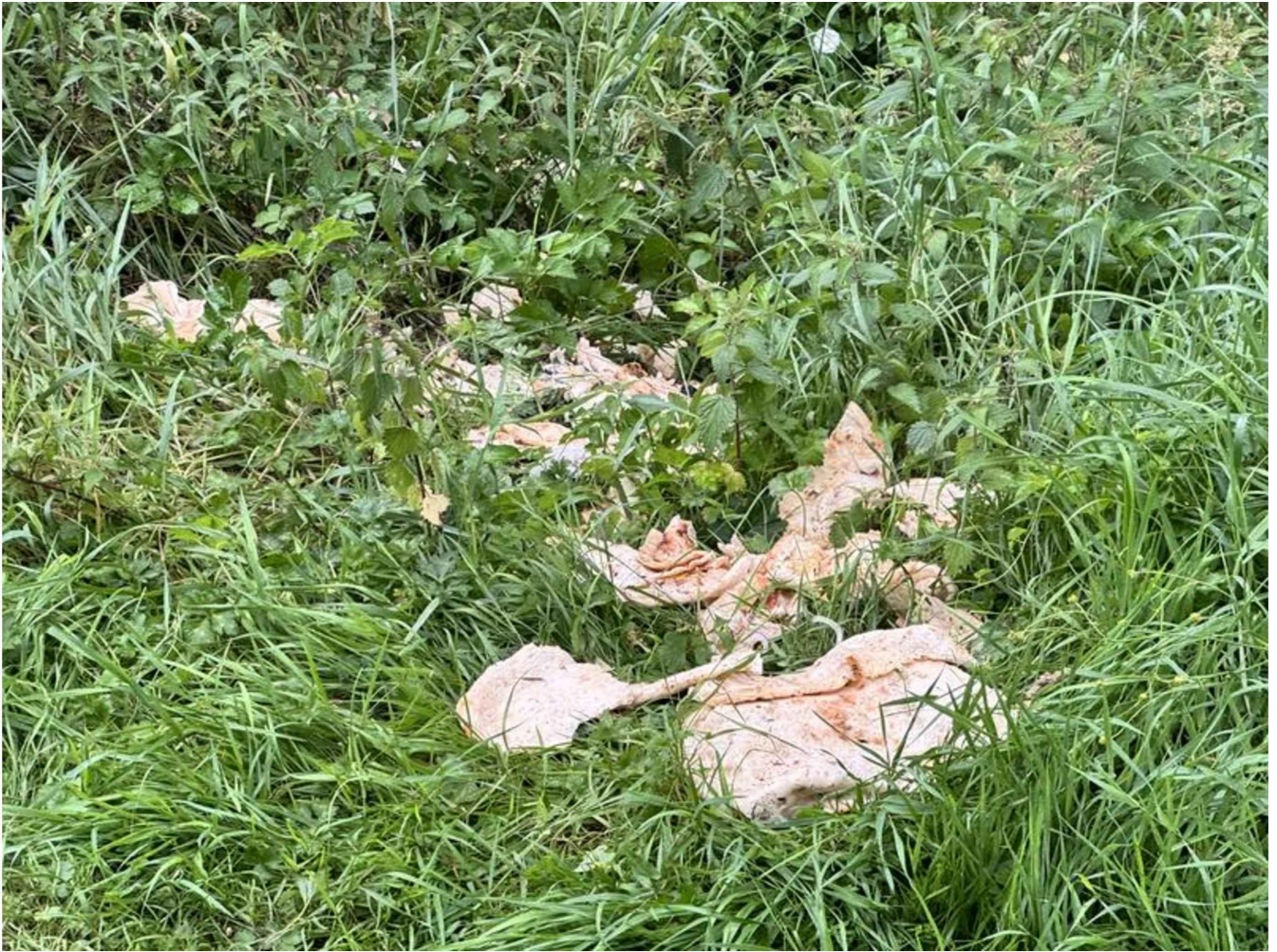
IMG_1827.jpeg op 19-08-2024 20:39 door melder