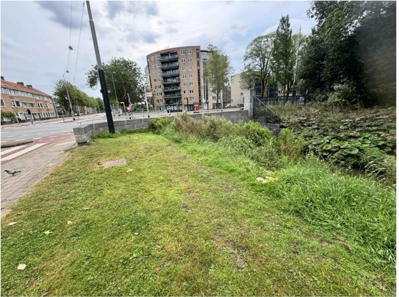
IMG_1828.jpeg op 19-08-2024 20:39 door melder