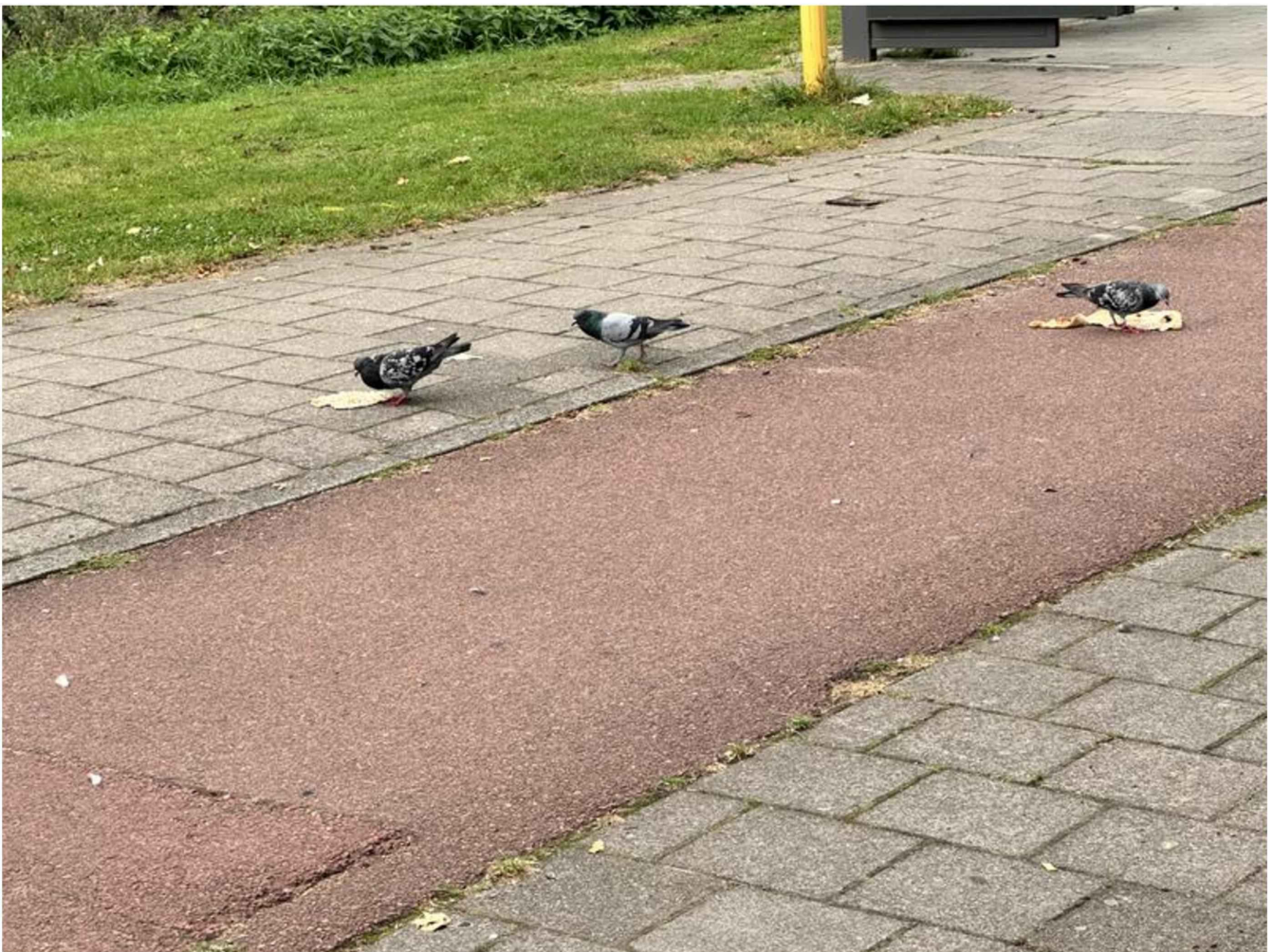
IMG_1824.jpeg op 19-08-2024 20:39 door melder