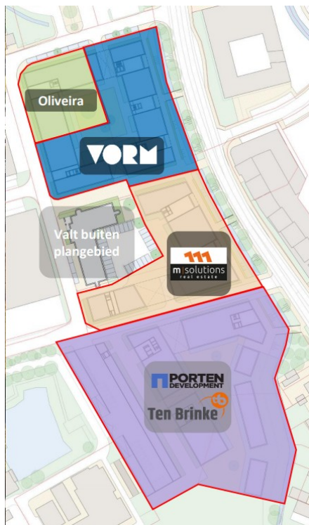
Figuur 3. Betrokken partijen Cacaokwartier. @5.1, 2, e ; wellicht hier kort toelichten welke wijziging plaats heeft gevonden m.b.t. kavel VORM