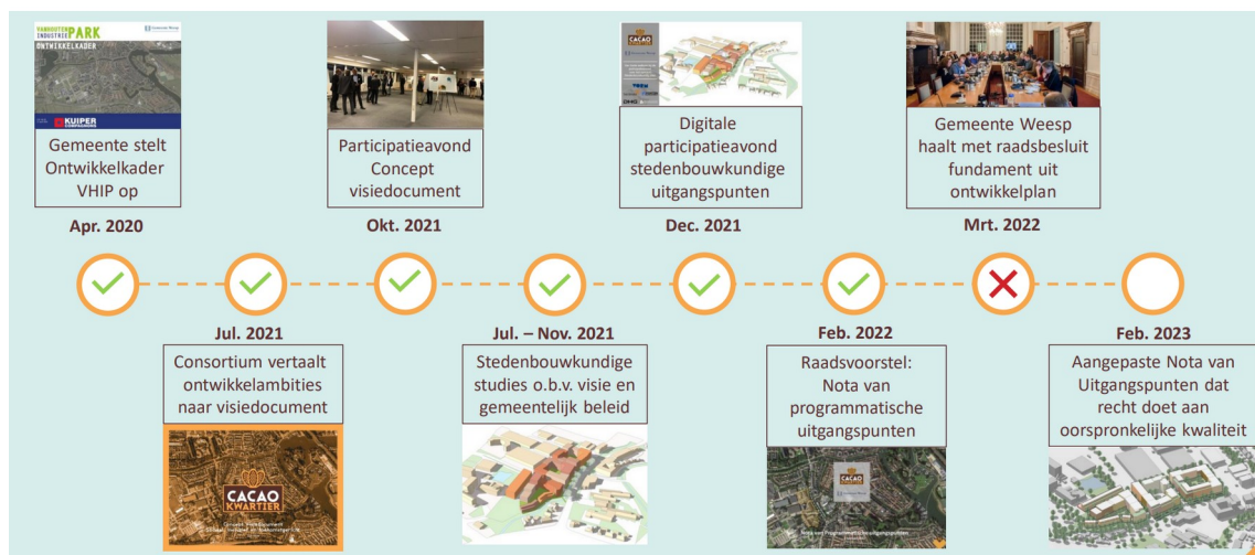
Figuur 1. Tijdlijn tot februari 2023

In onderstaande tijdlijn is weergegeven welke stappen in project Cacaokwartier hebben plaatsgevonden tot februari 2023. In februari 2023 is door initiatiefnemers een aangepaste nota van uitgangspunten voorgelegd aan de gemeente. In deze aangepaste nota van uitgangspunten hebben initiatiefnemers een voorstel gedaan dat zoveel mogelijk tegemoet komt aan het geamendeerde raadsbesluit van de toenmalige gemeenteraad van Weesp en recht doet aan de oorspronkelijke ruimtelijke kwaliteit van het plan.