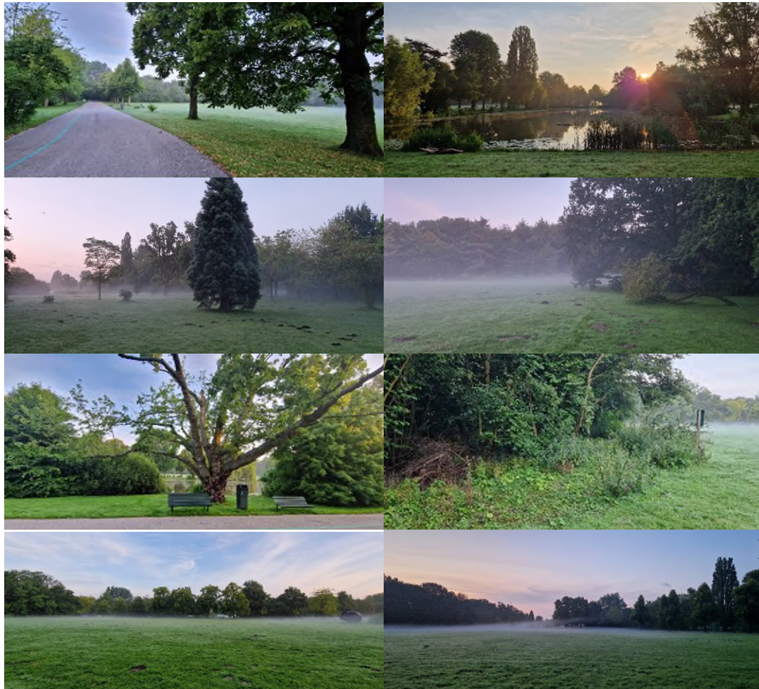
Figuur 1.3 Impressie van het terrein