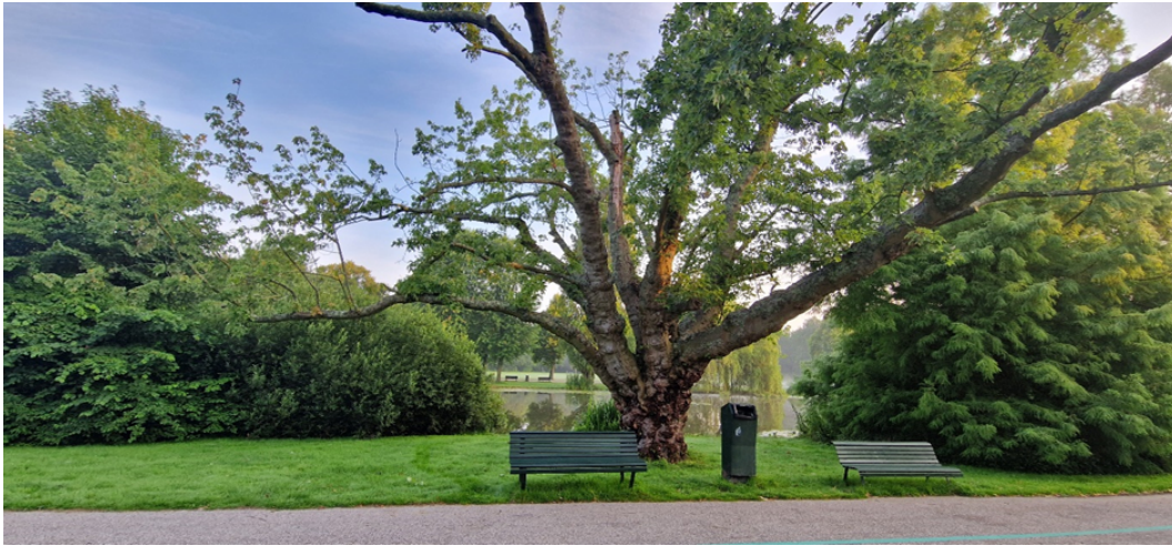
Figuur 3.8 Boom met holtes (locatie N17 op plattegrond)