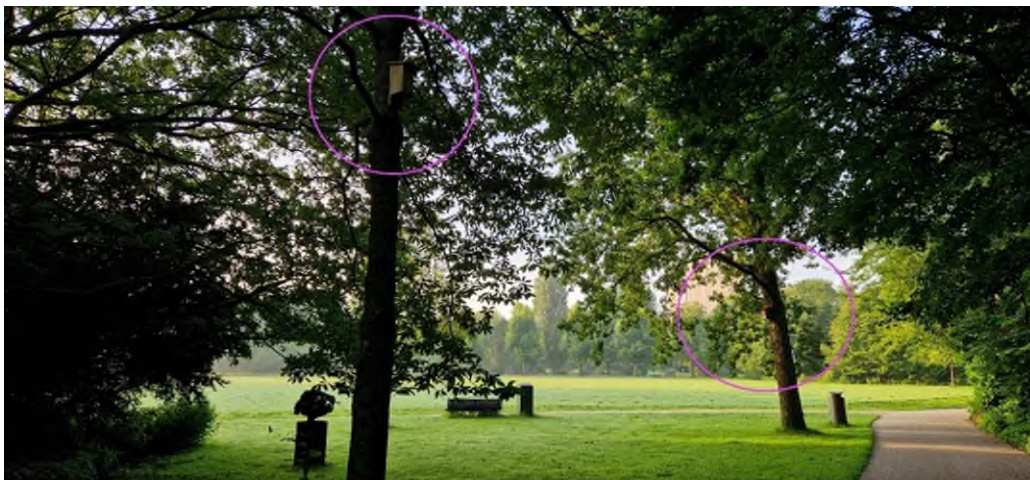
Figuur 3.4 Twee nestkasten ten noordwesten van het terrein

Er hangen vele nestkasten in het park, van mezen- tot bosuilkast. Er zijn geen indicaties van nog broedende vogels maar dit is niet uit te sluiten, ook kunnen bijvoorbeeld kasten gebruikt worden om te overnachten of door vleermuizen in gebruik zijn. De kasten mogen daarom niet aangelicht worden. Bijna alle kasten hangen dieper in de vegetatie en worden daarom sowieso al niet verlicht. De bovenstaande maatregel is noodzakelijk voor de twee kasten in onderstaand figuur 3.4. Deze kasten hangen bij het beeld 'de worstelaars' aan de noordwest kant van het veld, deze kasten hangen wat meer open. Daarnaast mogen er ook geen geluidsboxen, licht, rook, trillingen of obstakels in de buurt van nestkasten plaatsen worden (dit is ook van toepassing op vleermuiskasten).