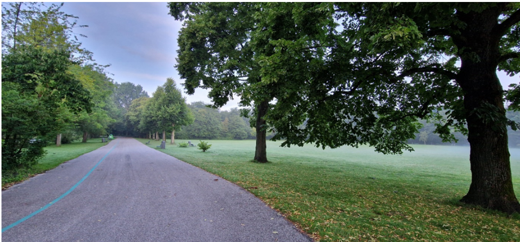
Figuur 3.7 twee Amerikaanse lindes (rechts) met diverse holtes (locatie J18 op plattegrond)