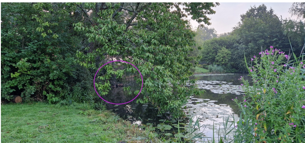
Figuur 3.5 Waargenomen meerkoetnest met grote jongen, hebben natuurlijke afscherming

Op het water in het hart van het park verblijven wilde/soepeend, meerkoet, waterhoen en zijn 2 ijsvogels kort waargenomen. De meerkoeten hebben een nest met grote jongen in de noordoosthoek van het wateroppervlak, het nest (figuur 3.5) bevindt zich achter de struiken onder overhangende bomen en heeft hierdoor een natuurlijke afscherming. Hier zijn geen aanvullende maatregelen nodig.