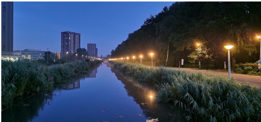
Figuur 3.8 Ringvaart ten zuiden Flevopark

Hier zijn geen lichtmasten gepland, tevens is het deel al verlicht door aanwezige lantaarnpalen (figuur 3.8). Verder zijn er geen maatregelen van toepassing. De oevers zijn al toegankelijk door de brede rietkraag en aan beide kanten loopt een weg. Hiermee is er al een zekere mate van verstoring waar soorten aan gewend zijn.