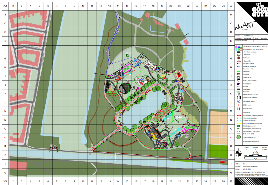
Figuur 1.2 Beoogde plattegrond van het No-Art festival