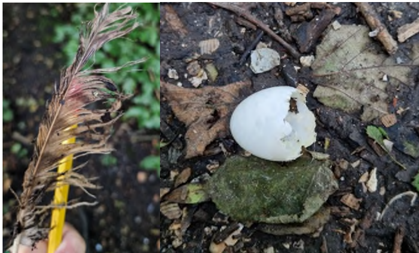
Figuur 3.3 Gevonden rui pen van ransuil en eischaal van houtduif

Verder zijn er geen indicaties van broedende uilen in het park, wel laat een wat oudere rui pen van ransuil zien dat deze voorkomt in het park (figuur 3.3). Er is echter geen nest van ransuil waargenomen. Er is ook een eischaal van houtduif aangetroffen, wat kan wijzen op uitgekomen jongen in de omgeving, maar er is geen bezet nest van houtduif aangetroffen op kwetsbare locaties. Voor ransuil en de houtduif zijn daarom geen maatregelen nodig.