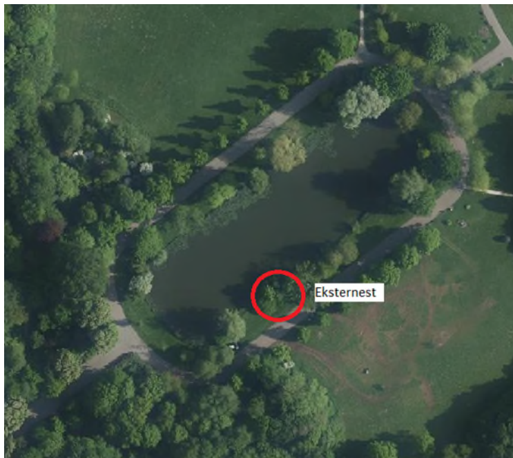
Figuur 3.1 Eksternest in boom langs centrale plas

Tijdens de controle zijn er veel vogels waargenomen. Enkele hiervan zijn: putter, zanglijster, merel, grote bonte specht, groene specht, koolmees, pimpelmees, staartmees, roodborst, zwartkop, winterkoning, houtduif, holenduif, ekster, kauw, zwarte kraai, halsbandparkiet, Alexanderparkiet, witte kwikstaart, boomkruiper, boerenwaluw en vink. Verder zijn er ook meerdere nesten in bomen waargenomen. Het gaat hier met name om enkele (oude) eksternesten en één kraaiennest. Een van de eksternesten bevindt zich in een boom bij de centrale plas, zie onderstaande figuur 3.1. Bij dit nest noch bij de andere nesten zijn indicaties waargenomen dat deze nesten momenteel nog in gebruik zijn. Bij de volgende broedvogelcontrole wordt dit nogmaals gecontroleerd.