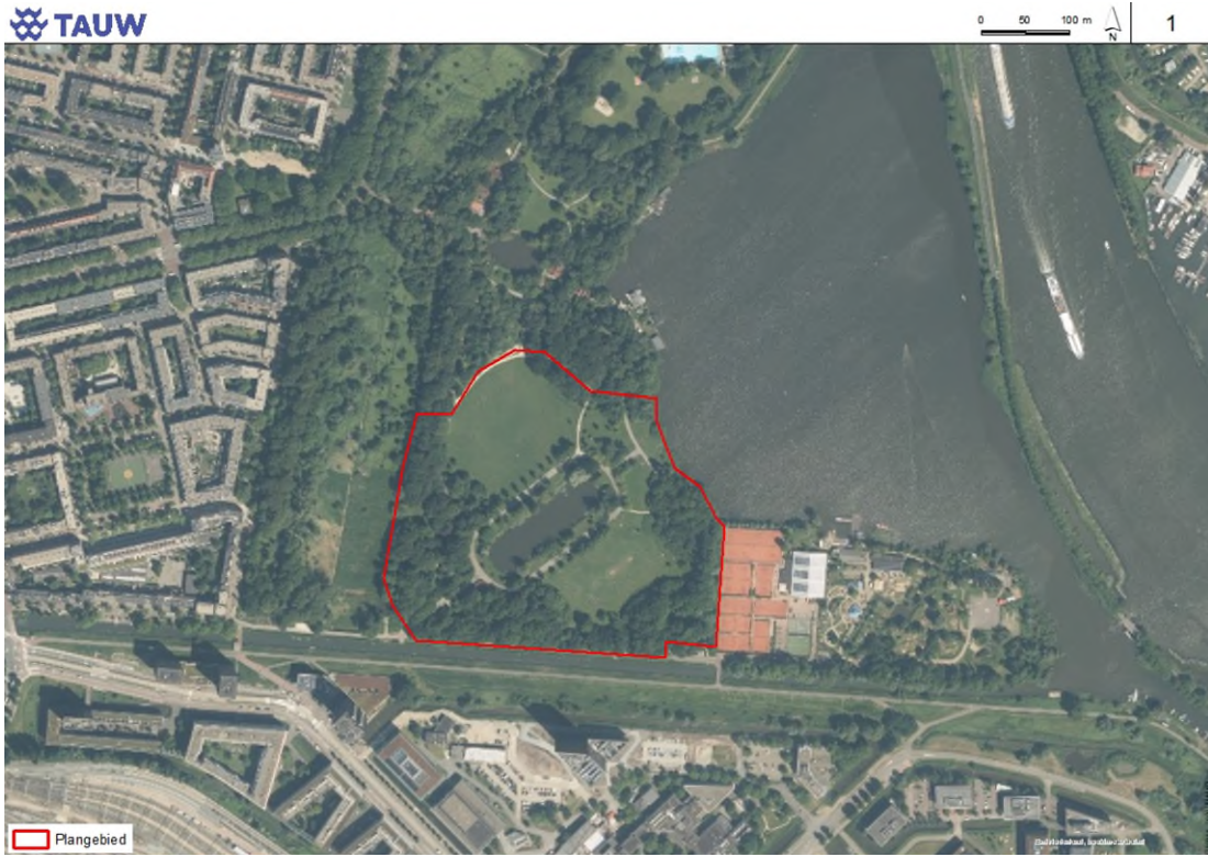
Figuur 1.1 Ligging van de terreinen 2023 en 2024 (globaal begrensd)