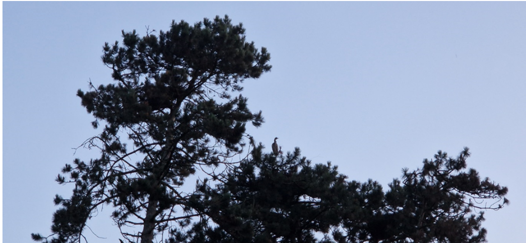
Figuur 3.2 Juvenile reiger op het nest, kan elk moment uitvliegen

Verder zijn er geen indicaties van broedende uilen in het park, wel laat een wat oudere rui pen van ransuil zien dat deze voorkomt in het park (figuur 3.3). Er is echter geen nest van ransuil waargenomen. Er is ook een eischaal van houtduif aangetroffen, wat kan wijzen op uitgekomen jongen in de omgeving, maar er is geen bezet nest van houtduif aangetroffen op kwetsbare locaties. Voor ransuil en de houtduif zijn daarom geen maatregelen nodig.