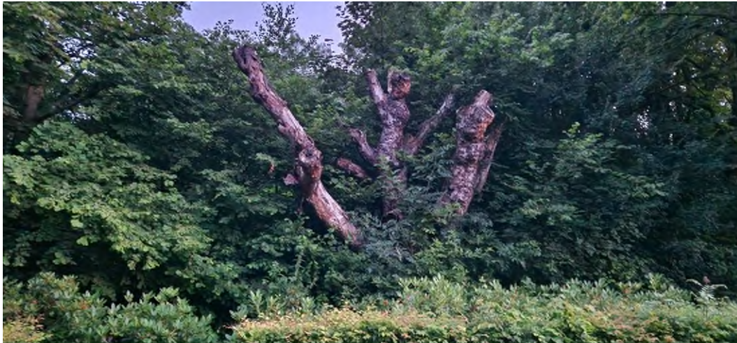
Figuur 3.6 boom met holtes en mogelijke verblijfplaats voor vleermuizen, langs het pad van de hoofdingang

Tijdens het plaatsen van lichtmasten moet hier rekening mee worden gehouden dat deze mogelijke verblijfplaatsen en foerageergebieden niet aangelicht mogen worden. Tijdens de tweede controle op 24 juli wordt hier aandacht aan besteed en op aanwijzing van de deskundige van TAUW wordt dan indien noodzakelijk maatregelen genomen om gevoelige delen donker te houden.