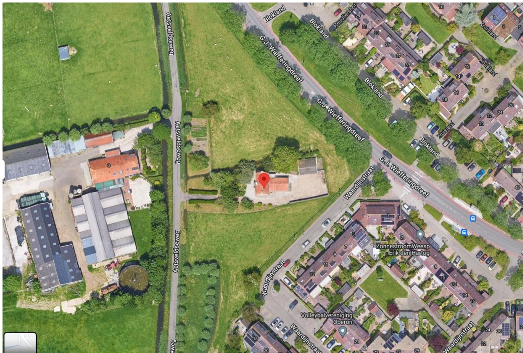
Afbeelding: huidige situatie Aetsveldseweg 1

een agrarisch bedrijf. In het noorden ligt de N236 die de scheiding vormt tussen Aetsveld en de rest van Weesp. Het plangebied bestaat voornamelijk uit grasland met daarop één vrijstaande woning met bijgebouwen en tuin. Verder zijn een moestuin aanwezig en enkele bomen die onderdeel uitmaken van de tuin bij de woning. De woning wordt op dit moment nog tijdelijk verhuurd en wordt ontsloten via de Aetsveldseweg.