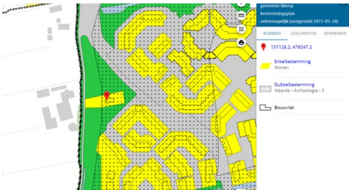
Afbeelding: uitsnede bestemmingsplan Stedelijk Gebied - Aetsveldseweg 1

Het perceel is gelegen in het bestemmingsplangebied Stedelijk Gebied en heeft deels de bestemming Wonen en deels de bestemming Groen. Binnen het bouwvlak is alleen de huidige woning toegestaan. Er is een dubbelbestemming Waarde - Archeologie - 3 op een deel van het perceel gelegen.