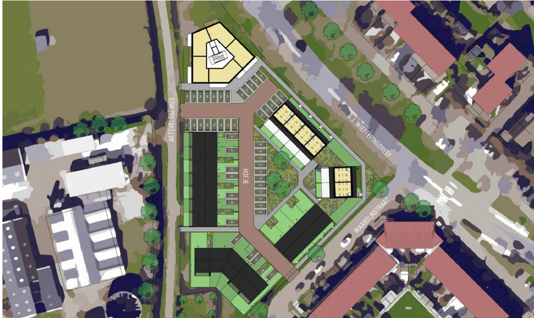
Afbeelding: plattegrond voorgenomen ontwikkeling