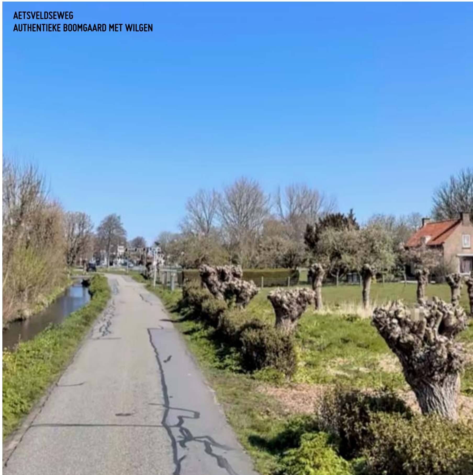
AETSVELDSEWEG AUTHENTIEKE BOOMGAARD MET WILGEN