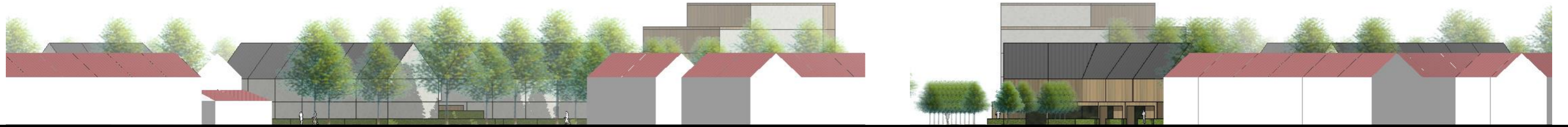
G.J. Wiefferingdreef / Waardijkstraat