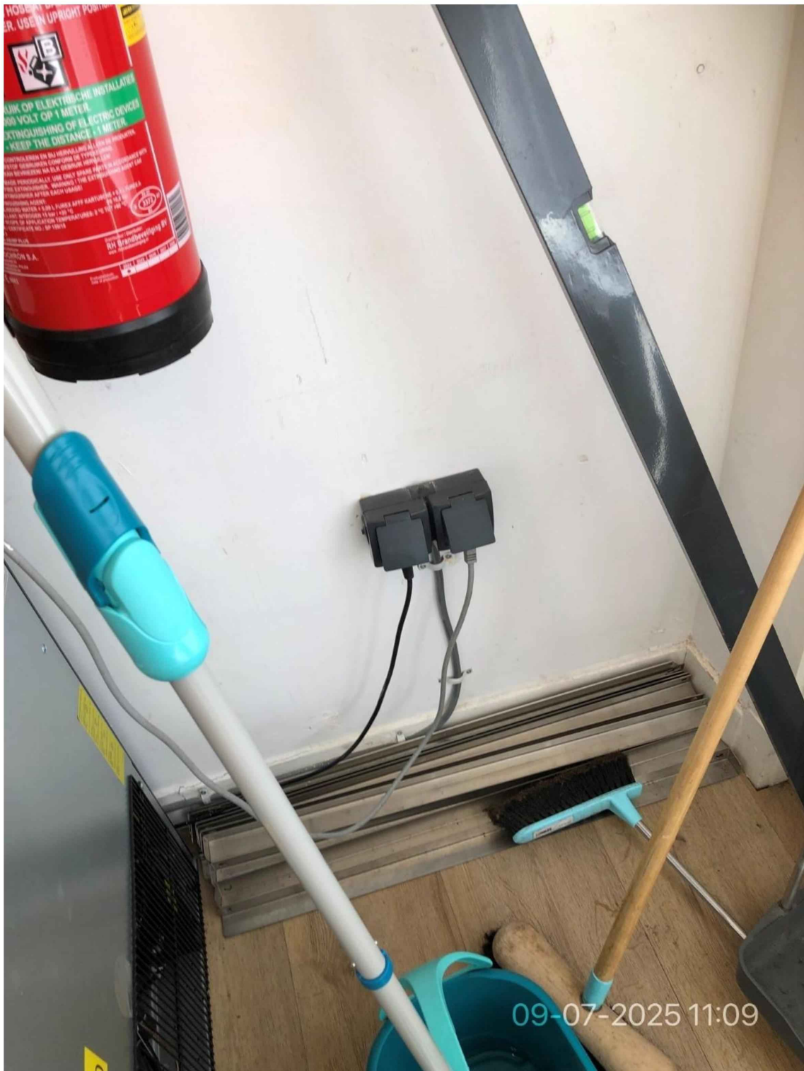
18. Nog een blusmiddel, gekeurd en opgehangen, geen pictogram aangebracht. Stekkerdozen zijn verwijderd, wandcontactdozen zijn aangebracht.