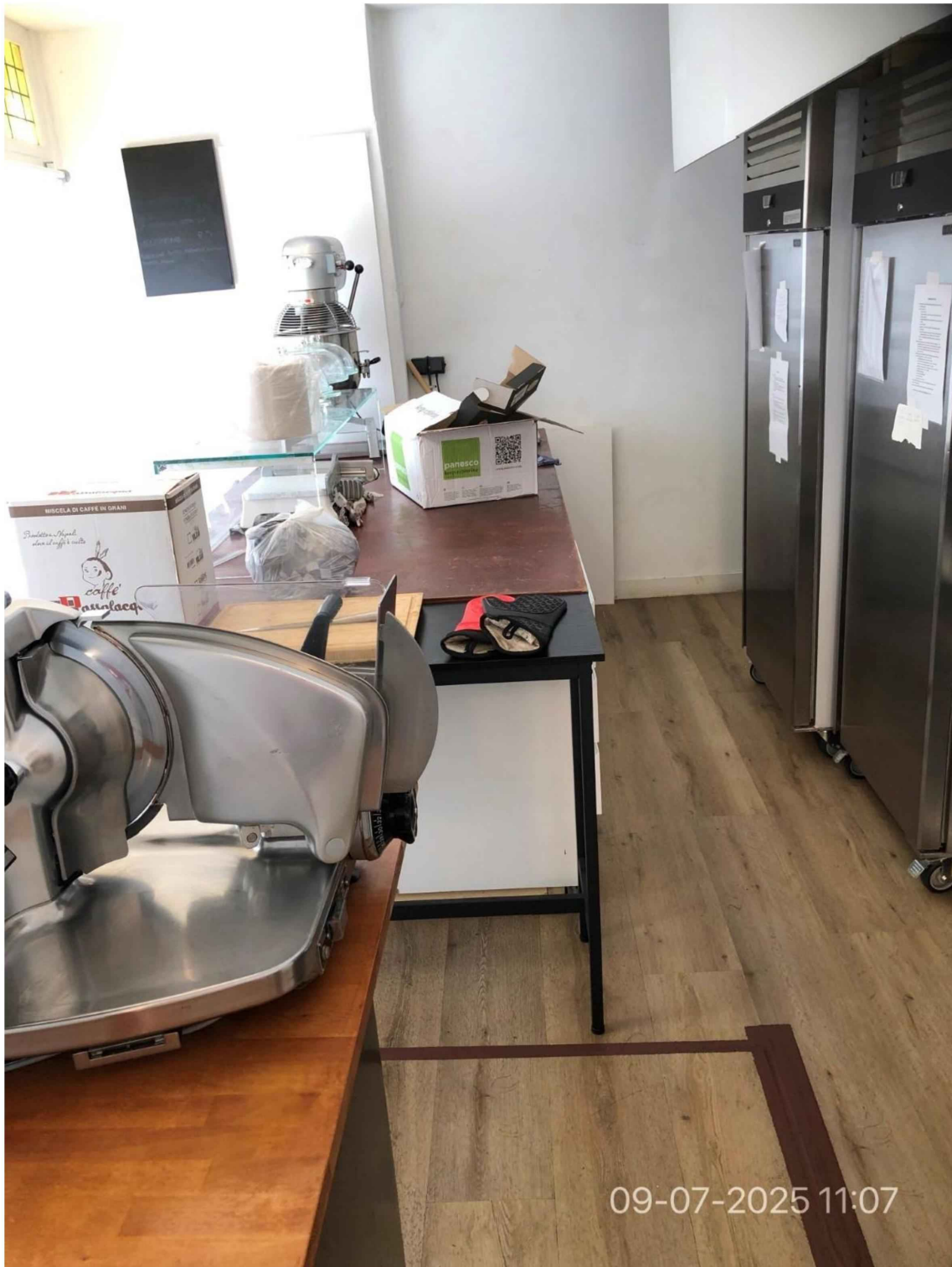
15. Pand Oude Spiegelstraat 2. Dit is de bereidingsruimte met rechts koelingen, een toonbank met vitrine met daarop apparatuur. Links een werktafel met snijmachine. Stekkerdozen verwijderd, wandcontactdozen aangebracht.