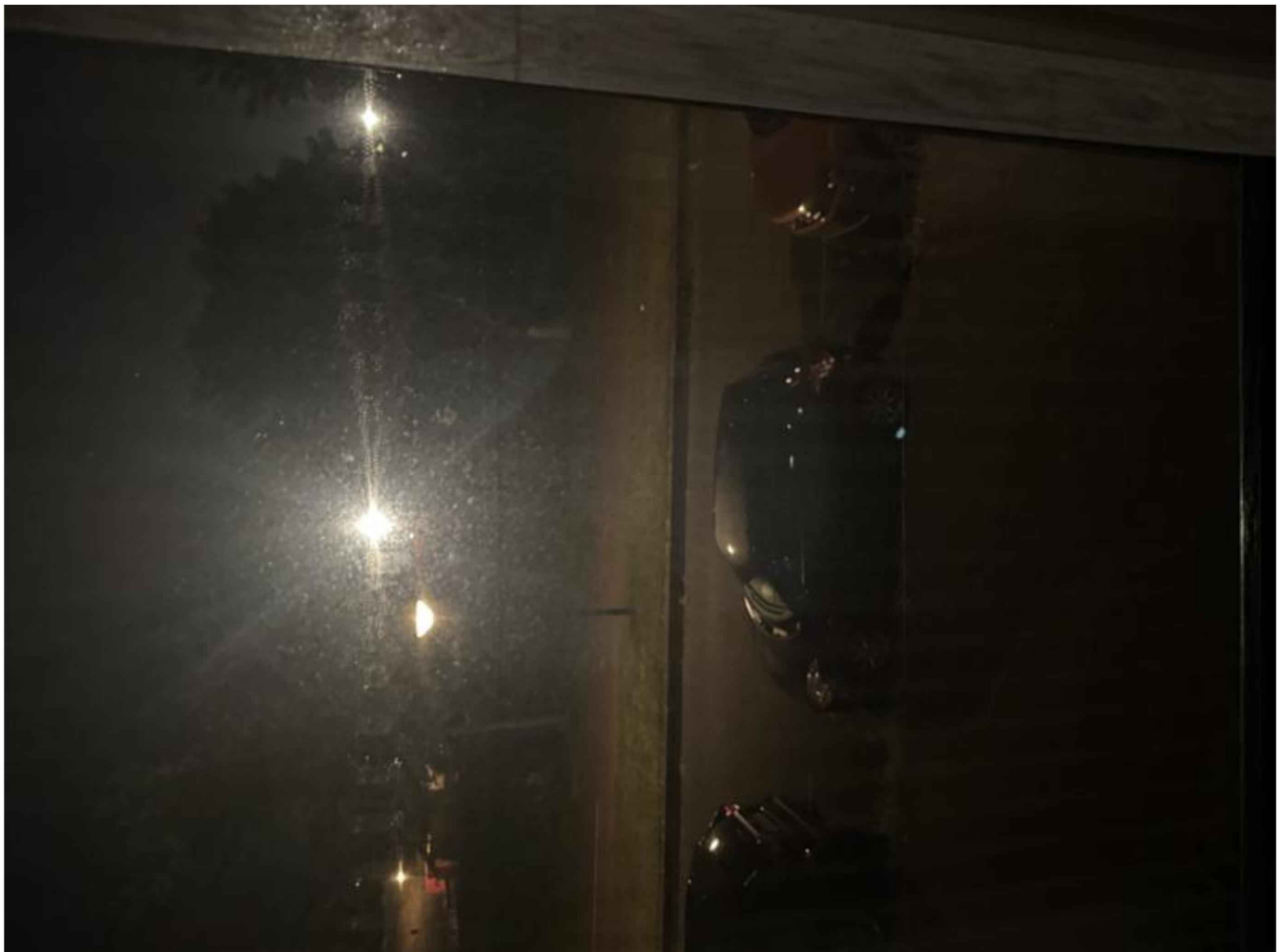
IMG_0561.jpeg op 13-07-2025 01:24 door melder