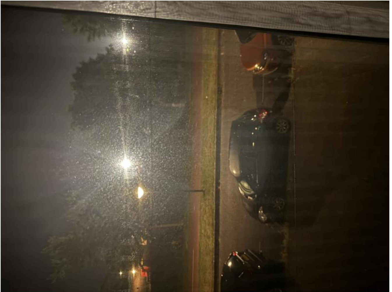
IMG_0558.jpeg op 13-07-2025 01:24 door melder