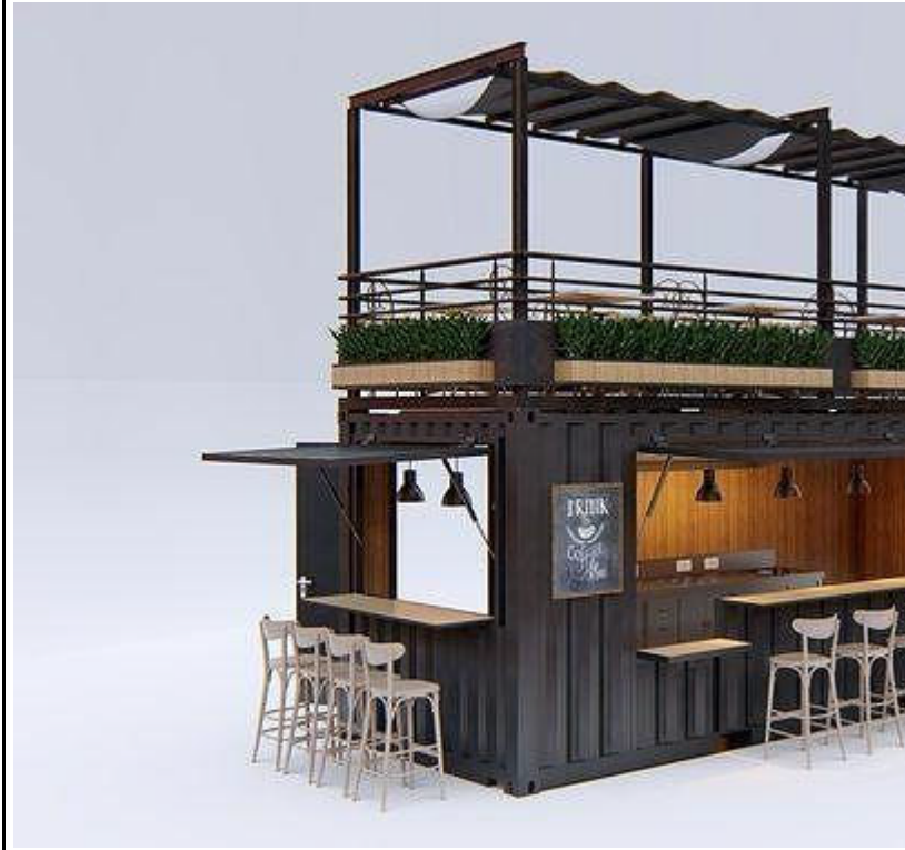
Foodtruck of vaste container

Voeg een foto in van uw verkoopunit of een unit die erop lijkt: