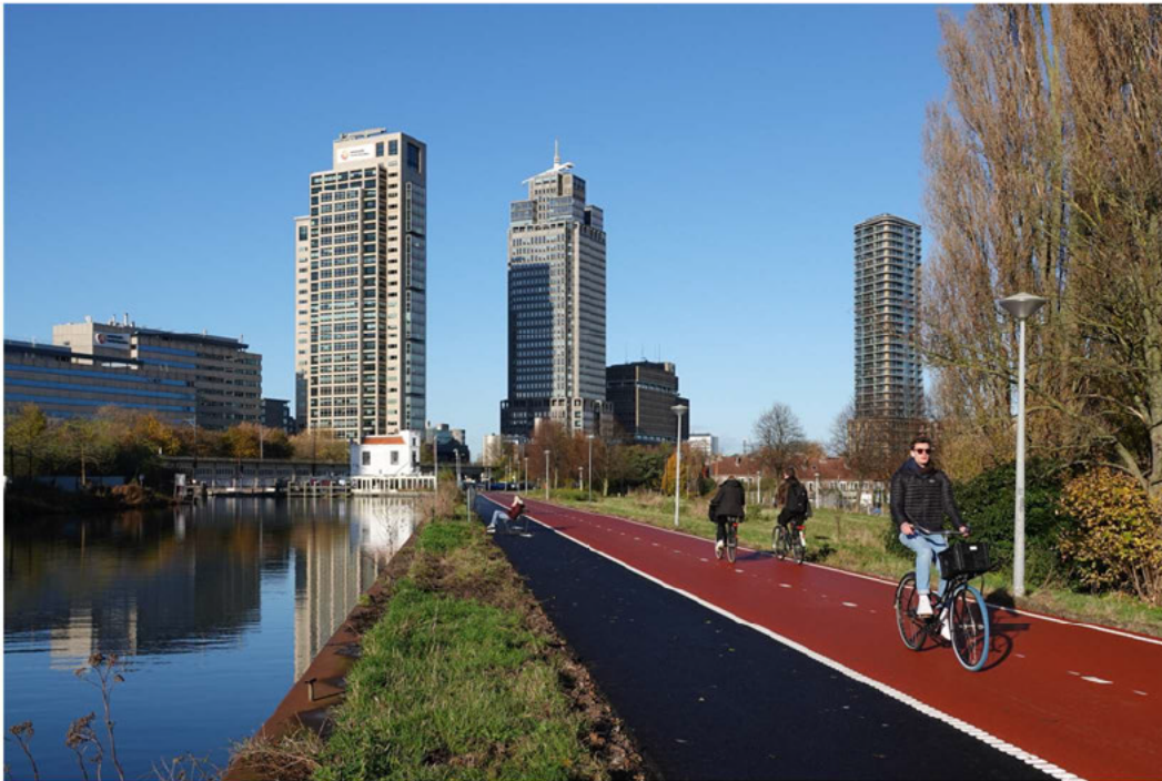
Weespertrekvaart

Deze Update informeert je over financiële werkprocessen binnen de gemeente Amsterdam. Deze update gaat over: