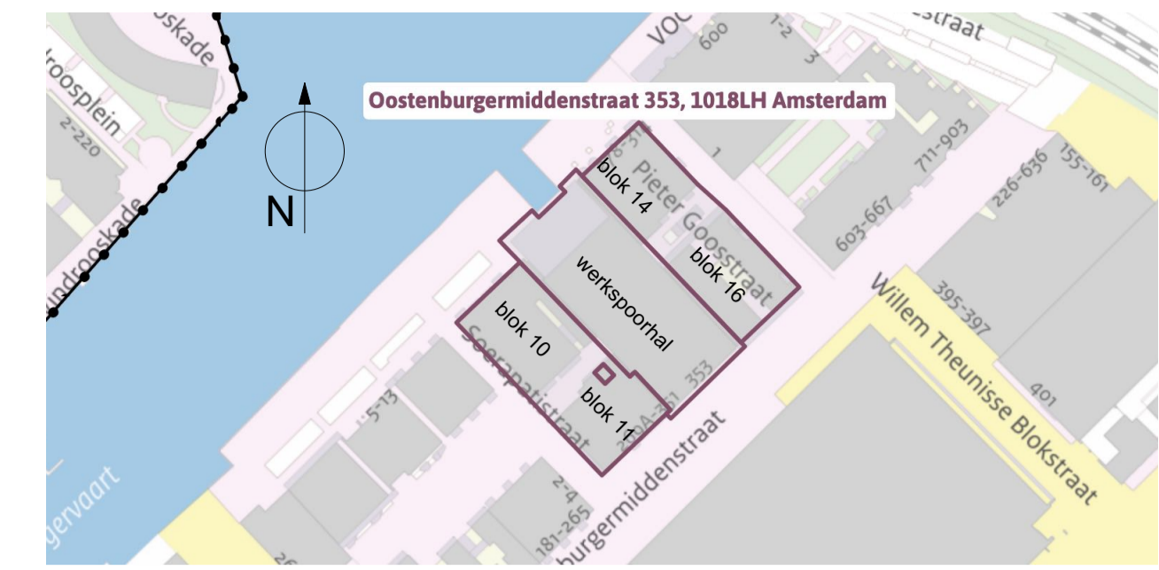
Situatie schaal 1:2000