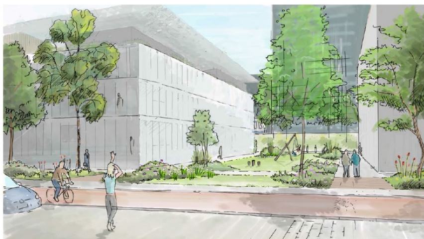
Afb. 25: Impressie C, tussenruimten Noordzijde (NPL en Strawinskyhuis), bij sloop-nieuwbouw