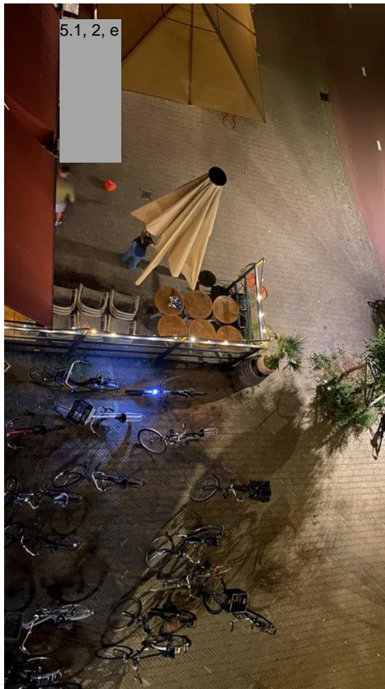
2024-08-24_23h25_luidruchtige_bezoekers_IMG_4868.jpeg op 05-09-2024 21:46 door melder