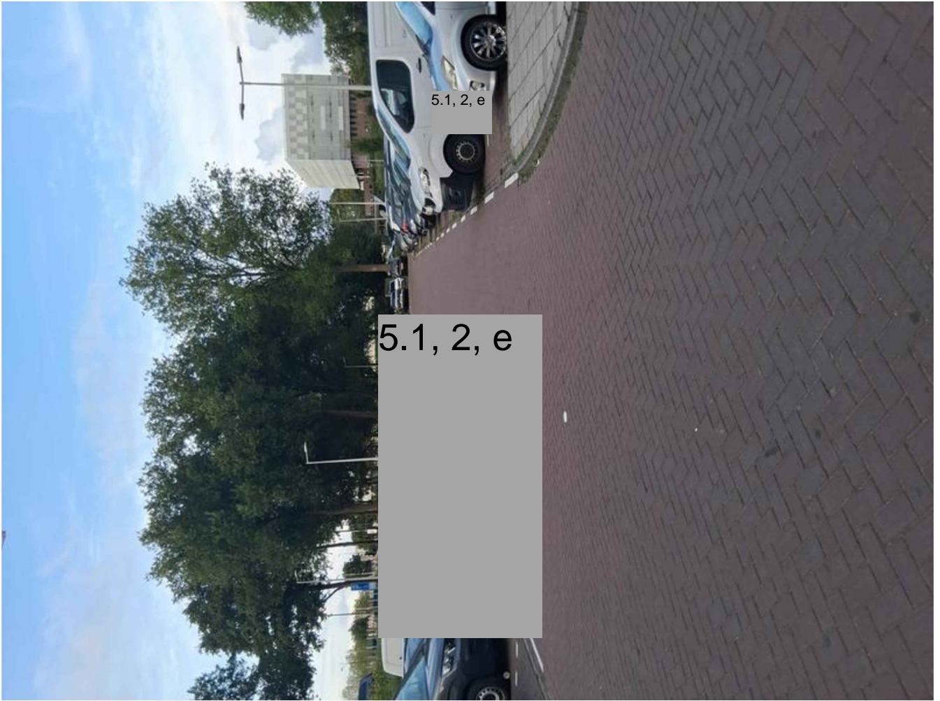
17536385712386336591662532335743.jpg op 27-07-2025 19:51 door melder