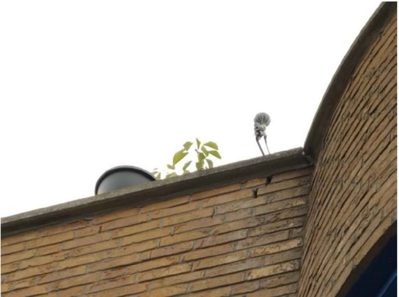
Kwaku25geluidTroepiaalsingel.jpg op 13-07-2025 18:20 door melder