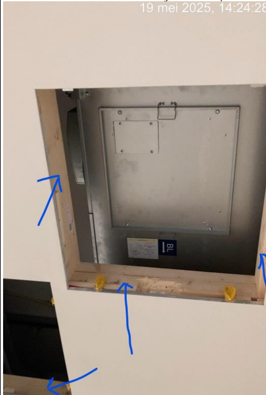
Foto2 : De blauwe pijlen geven de nieuwe positie van de balklaag van het verlaagde plafond aan. Een deel van de nieuwe luchtbehandelingsinstallatie is op de foto zichtbaar.