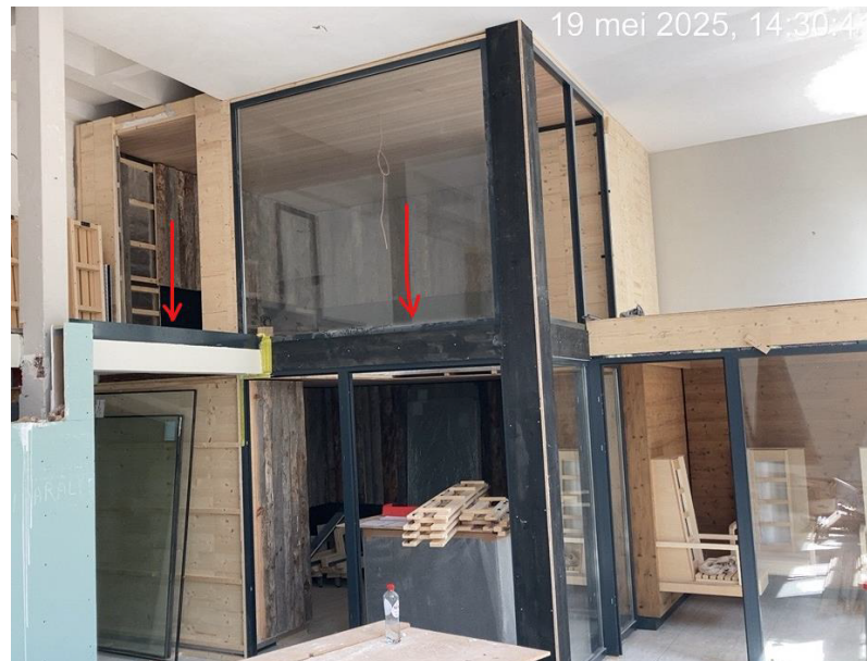
Foto3: De pijlen geven de boven vloer van de dubbeldeks sauna aan.