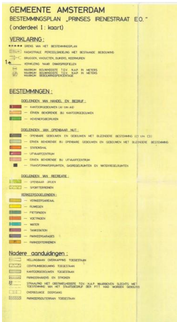
Figuur 2 : uitsnede van plankaart met legenda