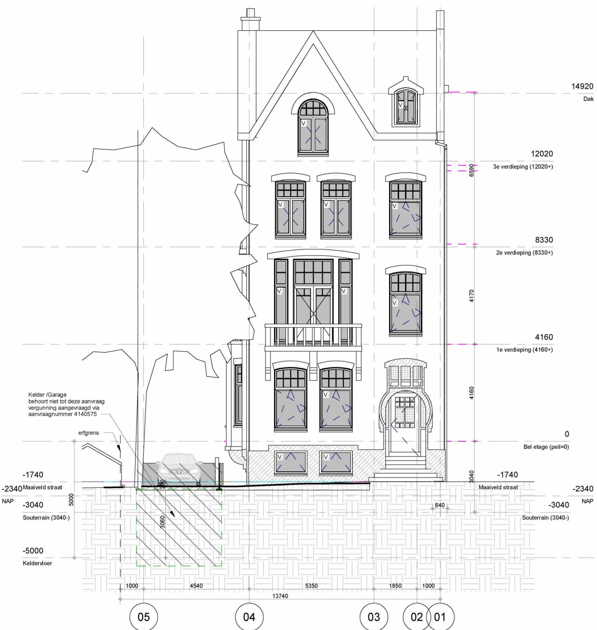
Zuidgevel (voorgevel) 1 : 100