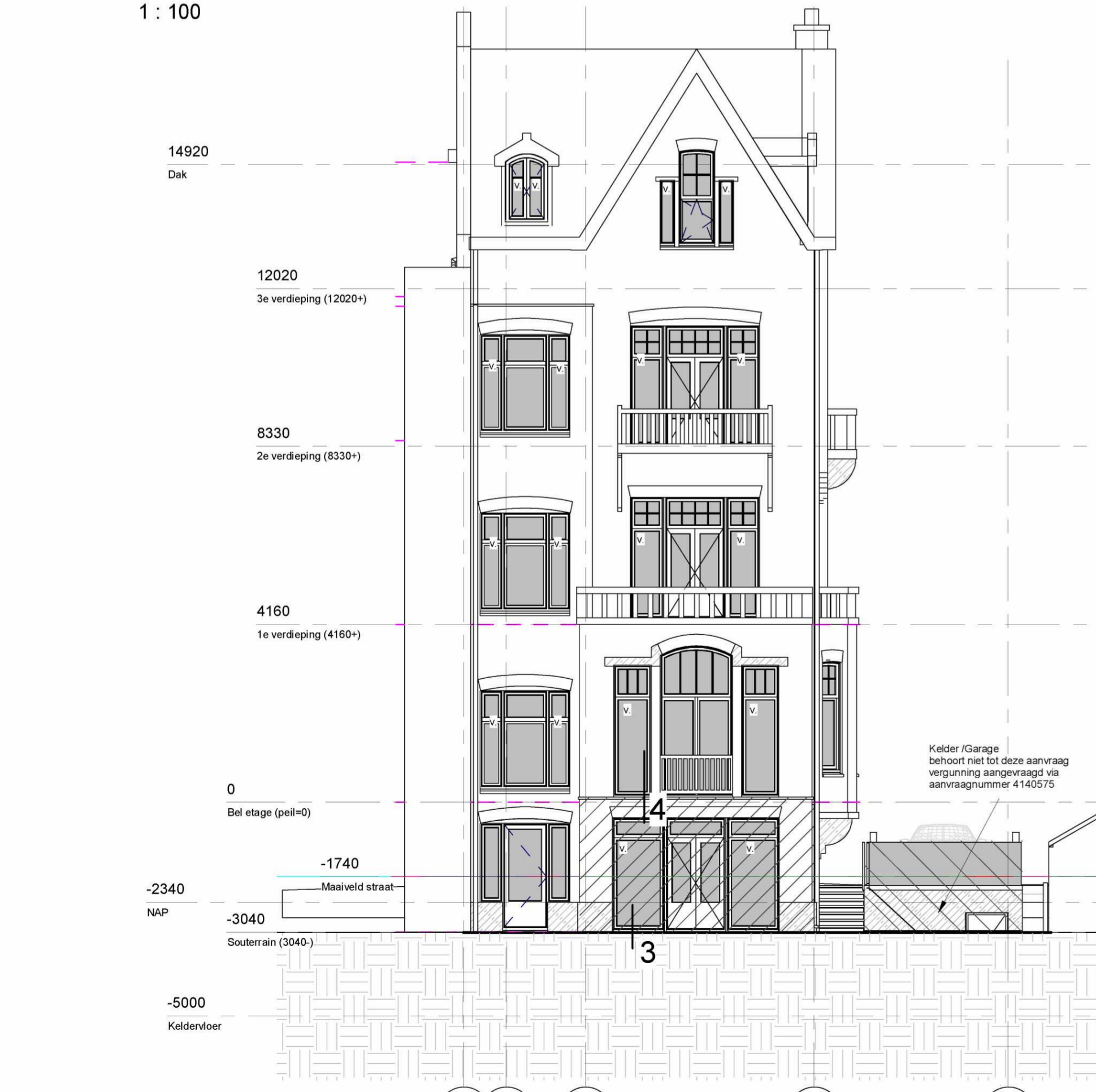
Noordgevel (achtergevel) 1 : 100