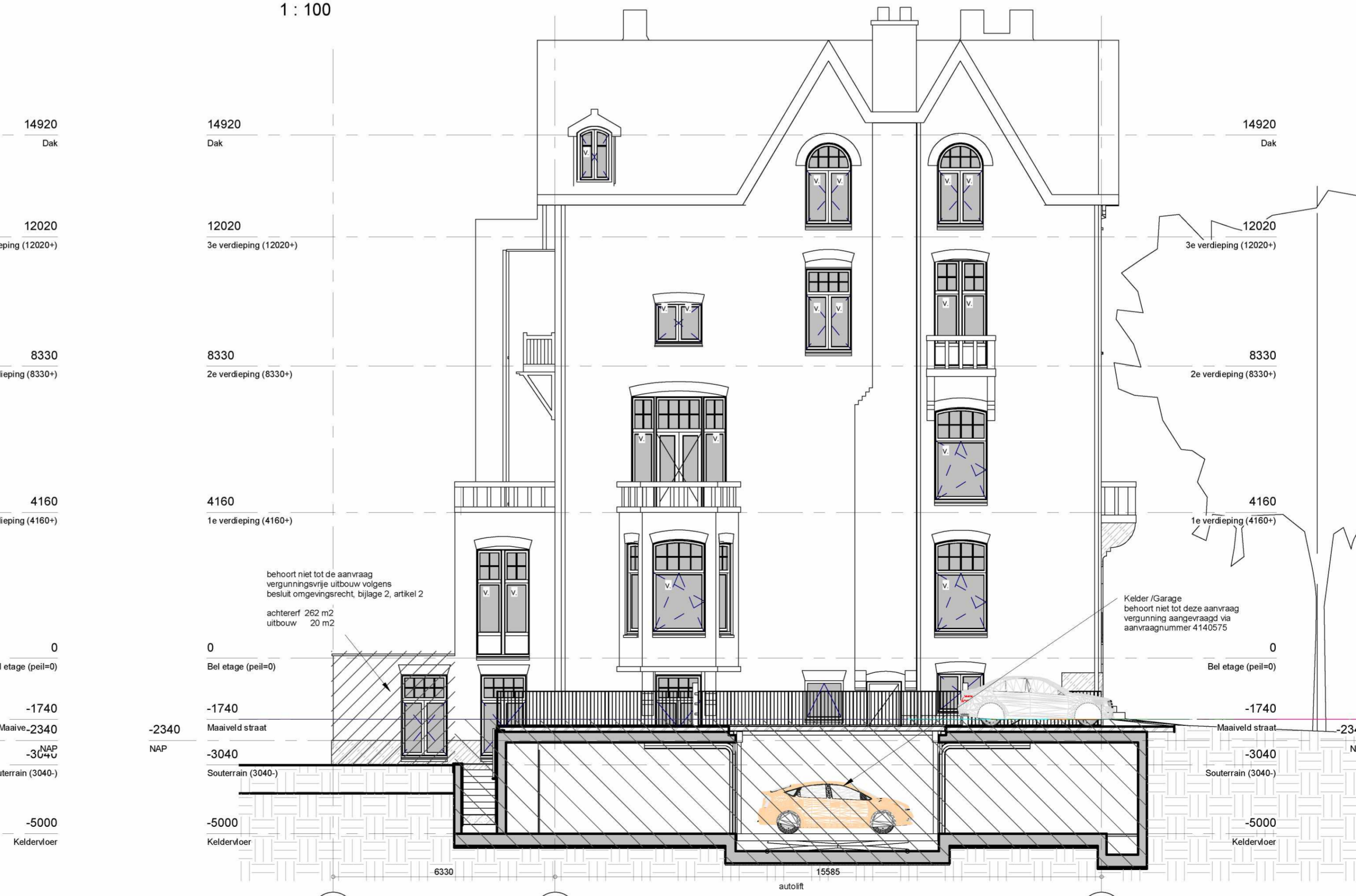
Westgevel (zijgevel) 1 : 100