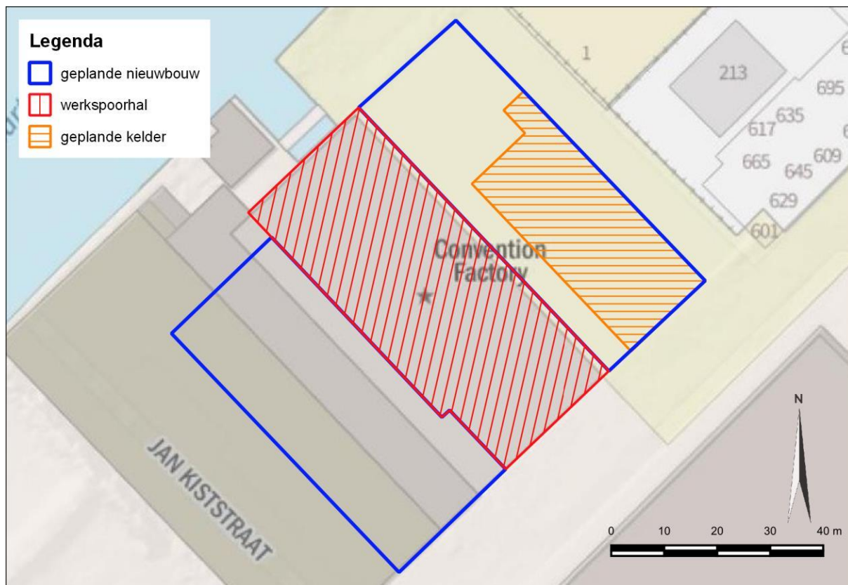
Figuur 3: Geplande werkzaamheden.