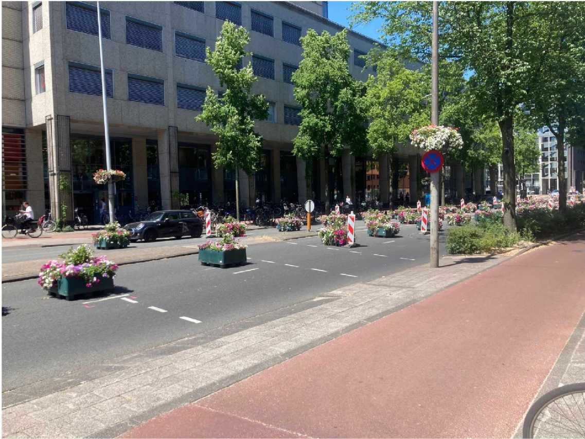
14. Weesperstraat tussen slagbomen --> Bord met keerlus voor slagboom stad in plaatsen