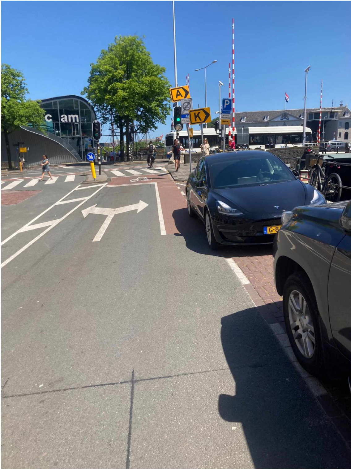
12. Einde Rapenburg --> bord dat er staat draaien + toevoegen bord 'Volg S100 pijl naar links'