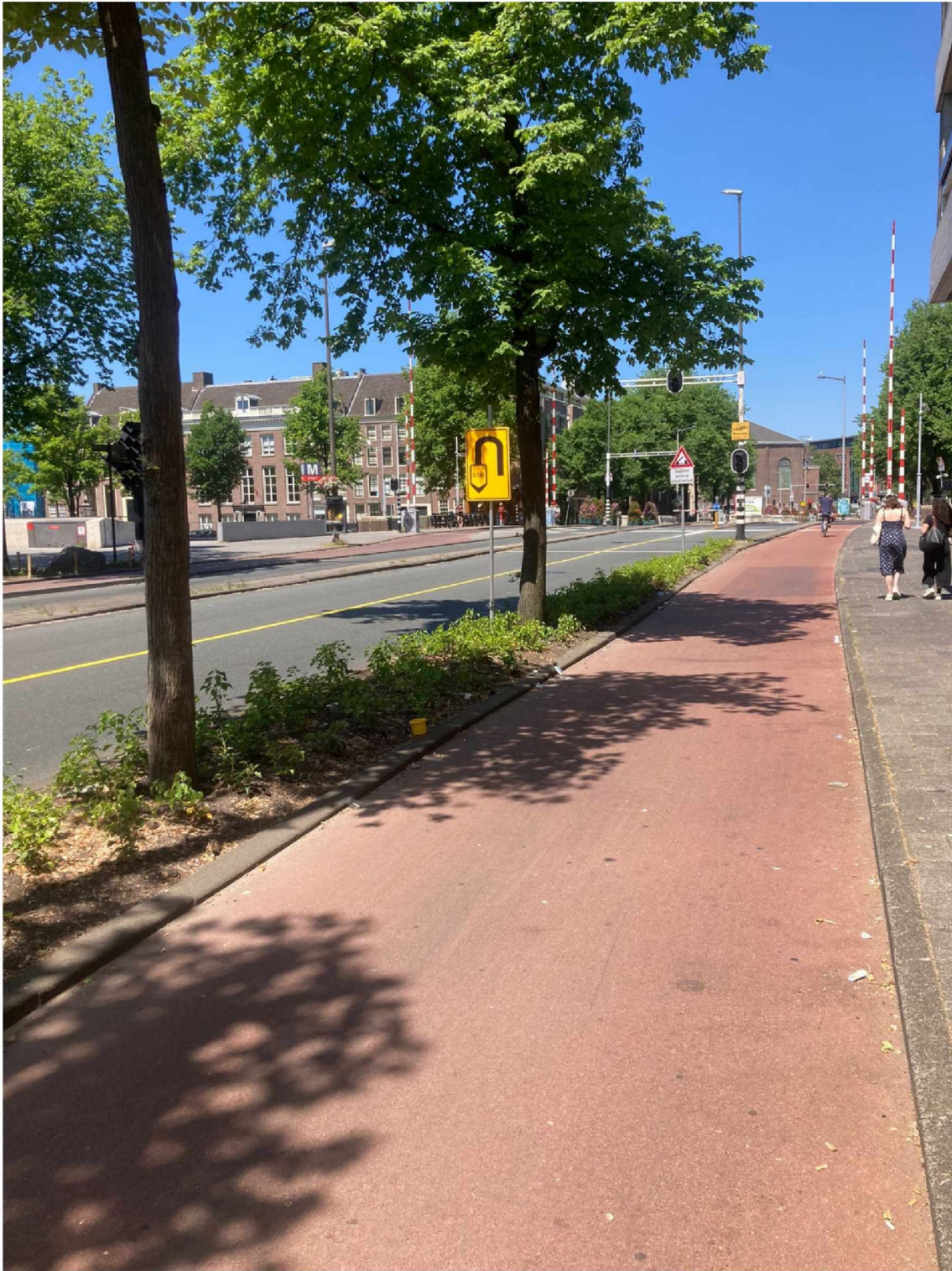
15. Bord Weesperstraat stad uit --> 'Nieuwe Keizersgracht bereikbaar' weg (alleen Waterlooplein volg s100)