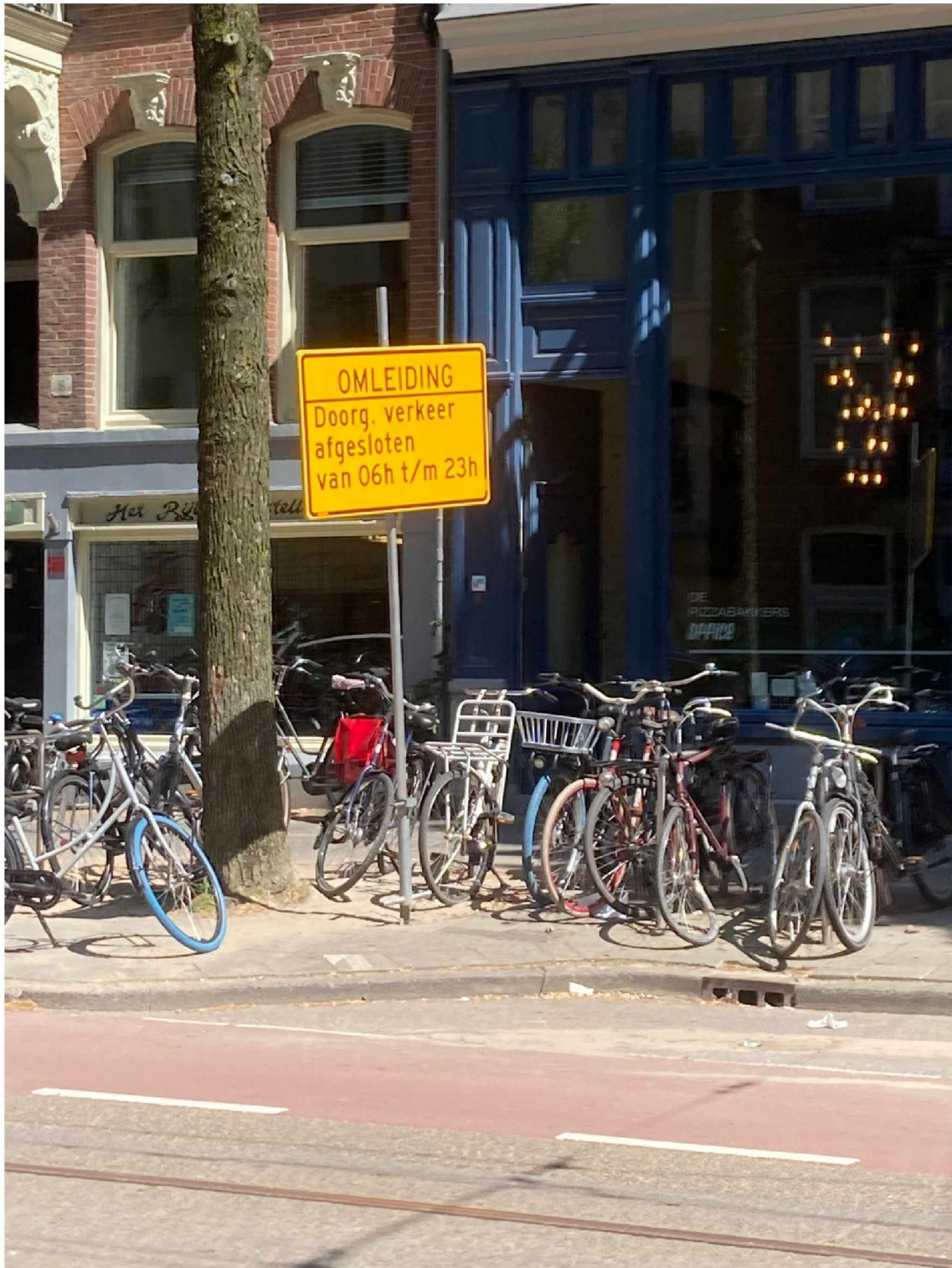
18. Kruising Rhijnspoorplein stad in --> bord plaatsen met 'Weesperstraat over 500 meter afgesloten tussen 6.00 en 23.00'