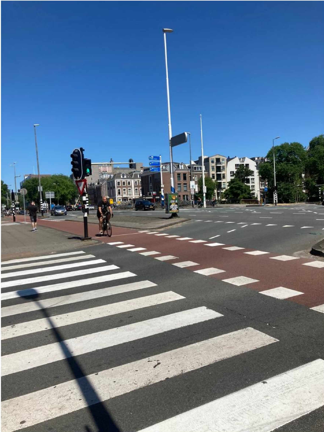
19. Rhijnspoorplein stad uit 'Weesperstraat afgesloten. Volg s100' bord