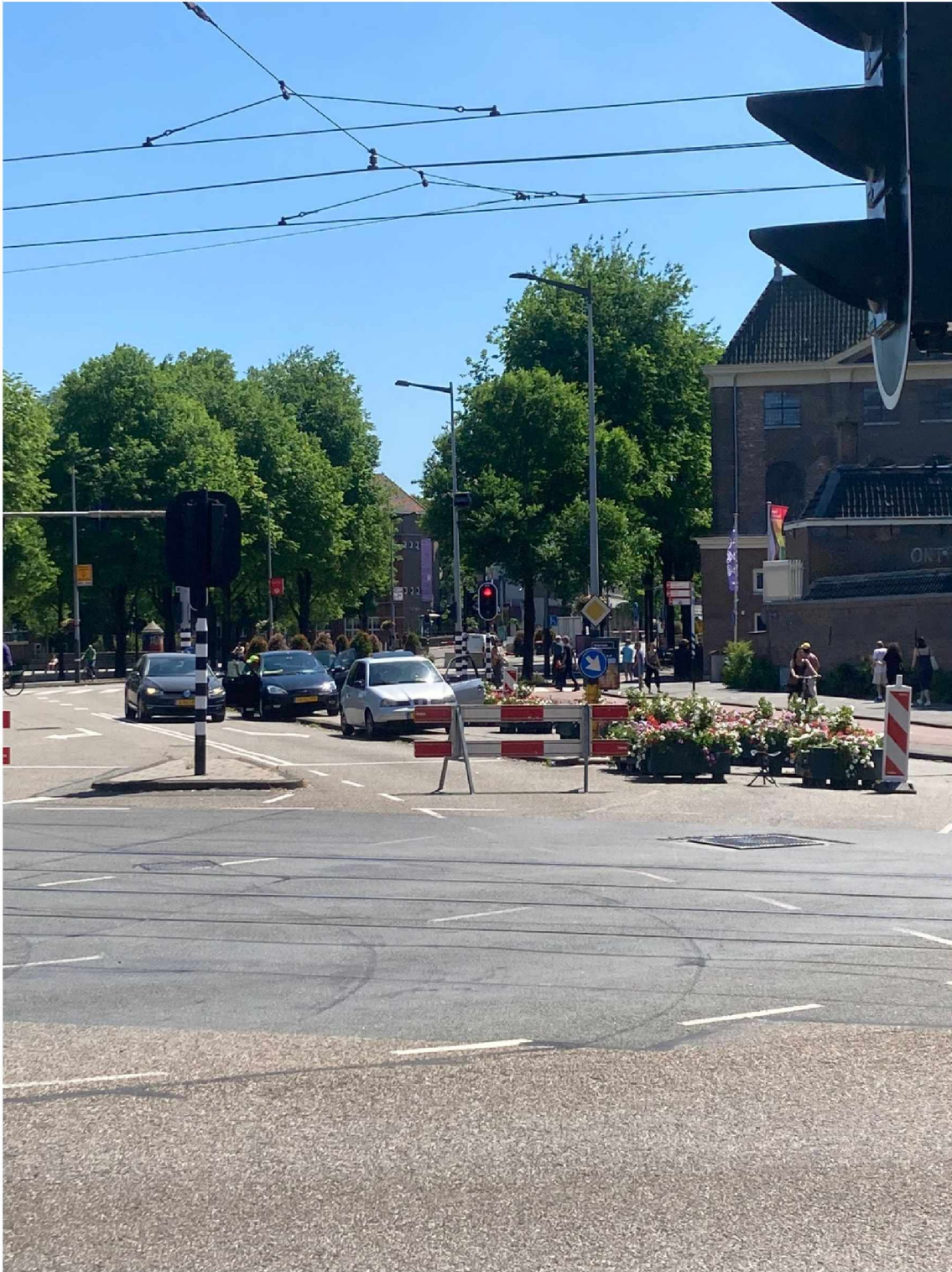
9. Weesperstraat/mr Visserplein --> bord richting Markenhoven verplaatsen voor keerlus