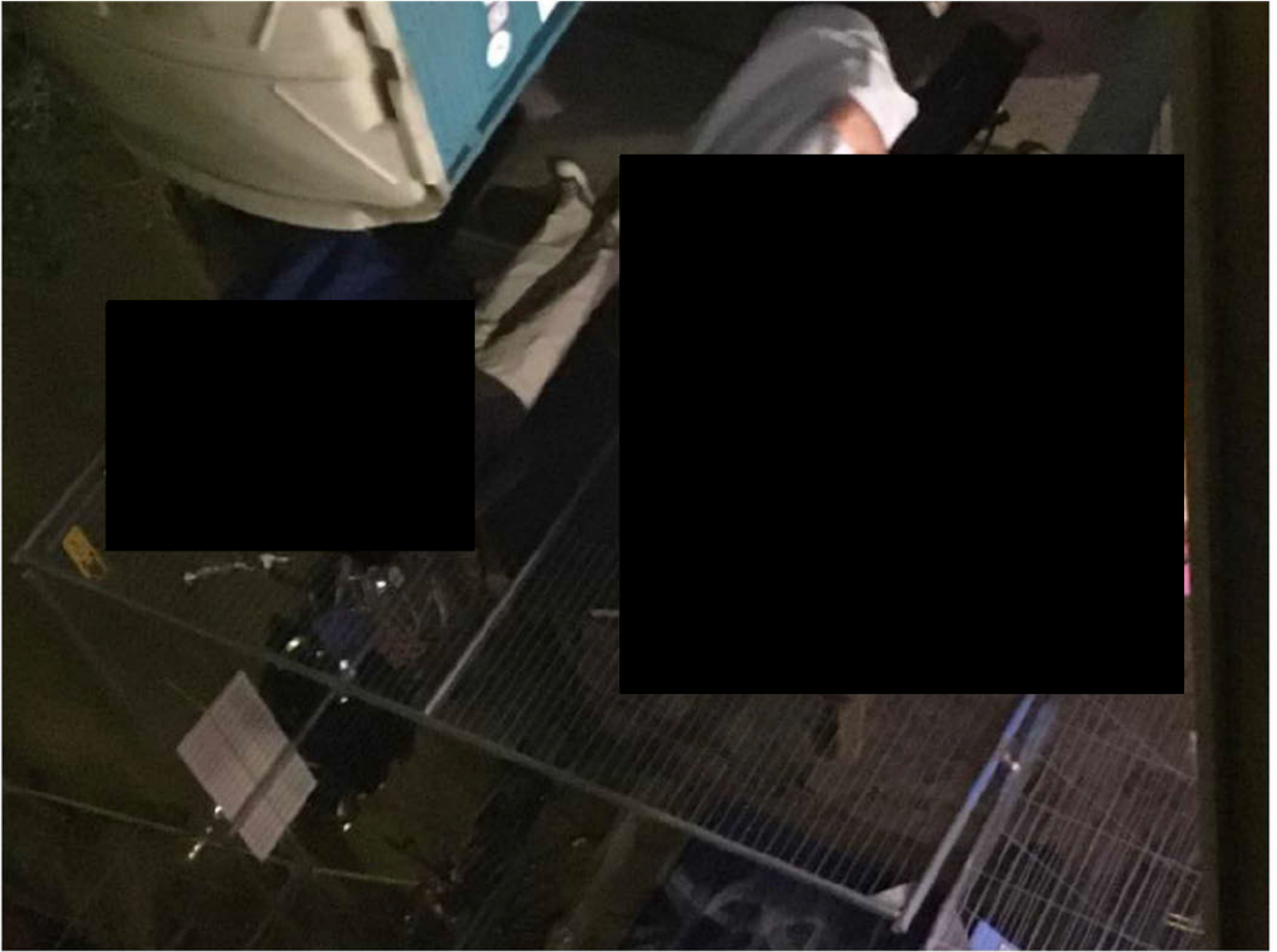
B64779B9-0F72-421F-84FE-174A5C2C0844.jpeg op 01-05-2024 22:34 door melder