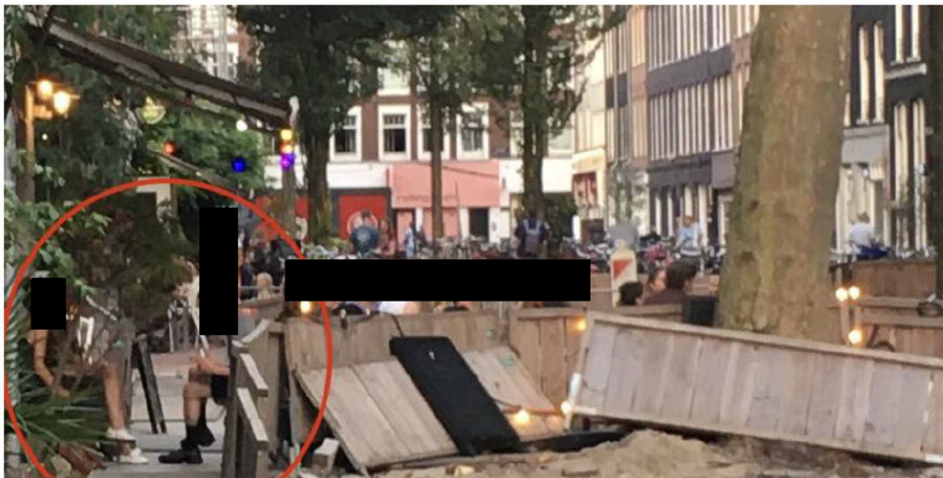
F091F11B-D915-4560-9D77-D14B736CB71D.jpeg op 14-08-2024 20:52 door melder