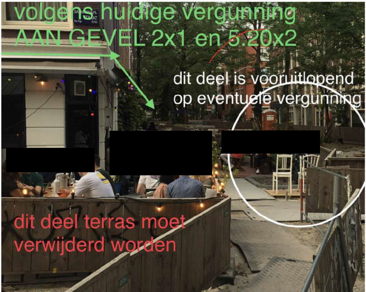
8AD2C613-0B7B-429E-AA64-8780249412B7.jpeg op 14-08-2024 20:52 door melder