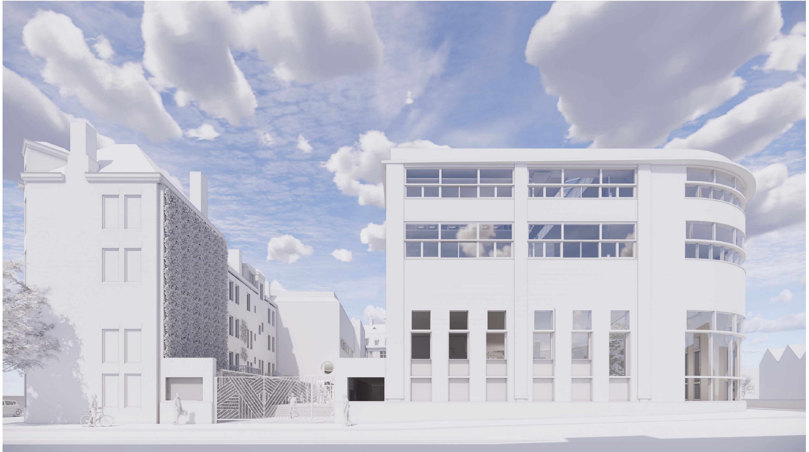
VARIANT 1 RAMEN ALS GEBOUW A