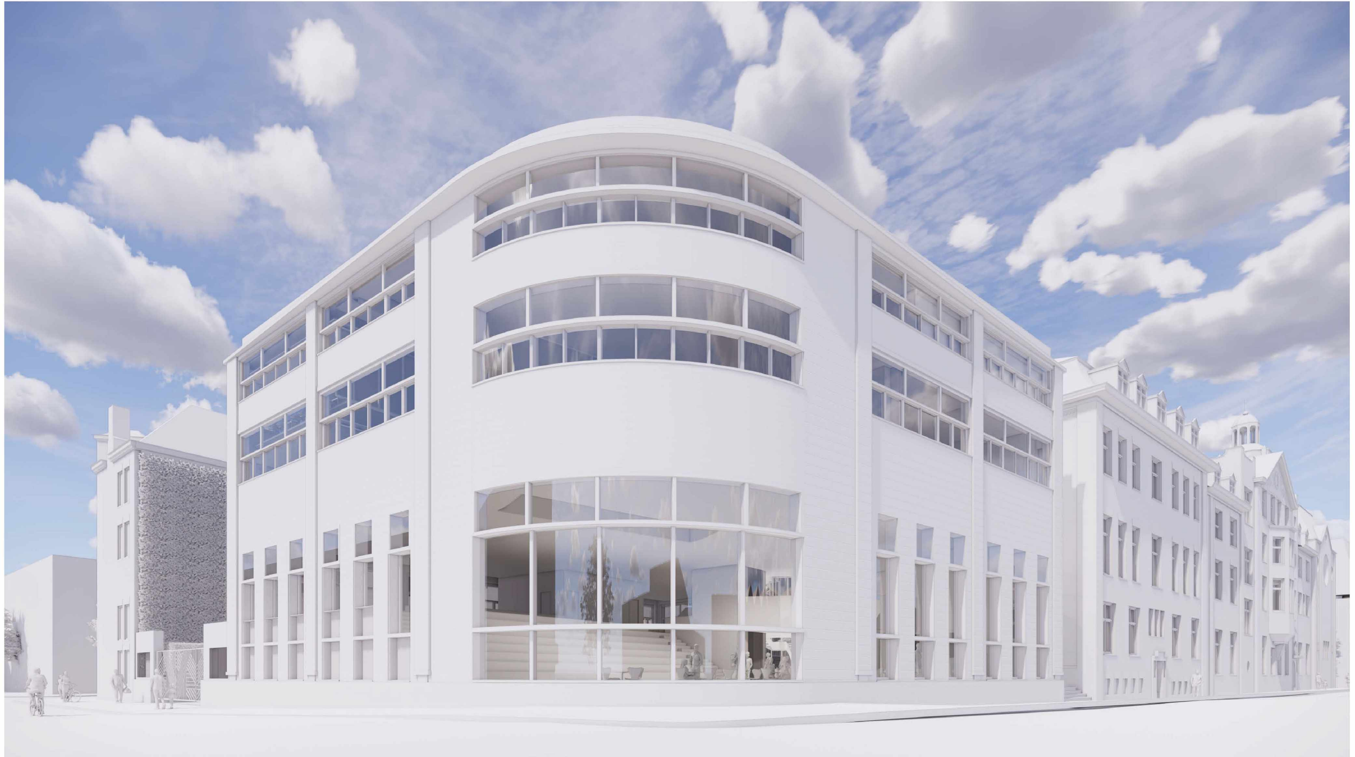
VARIANT 1 RAMEN ALS GEBOUW A