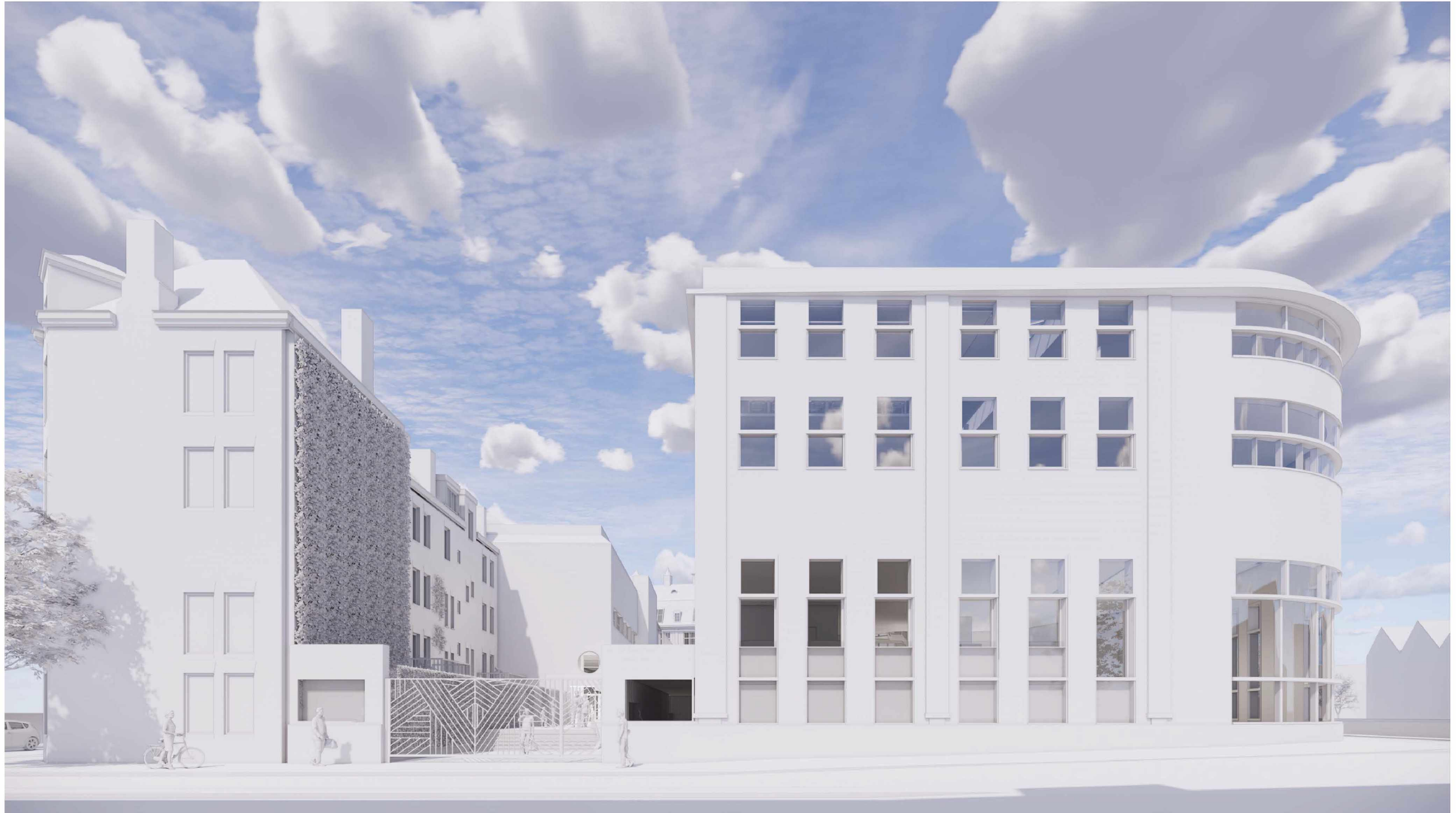
VARIANT 2 RAMEN VOLGENS RITME GEBOUW D