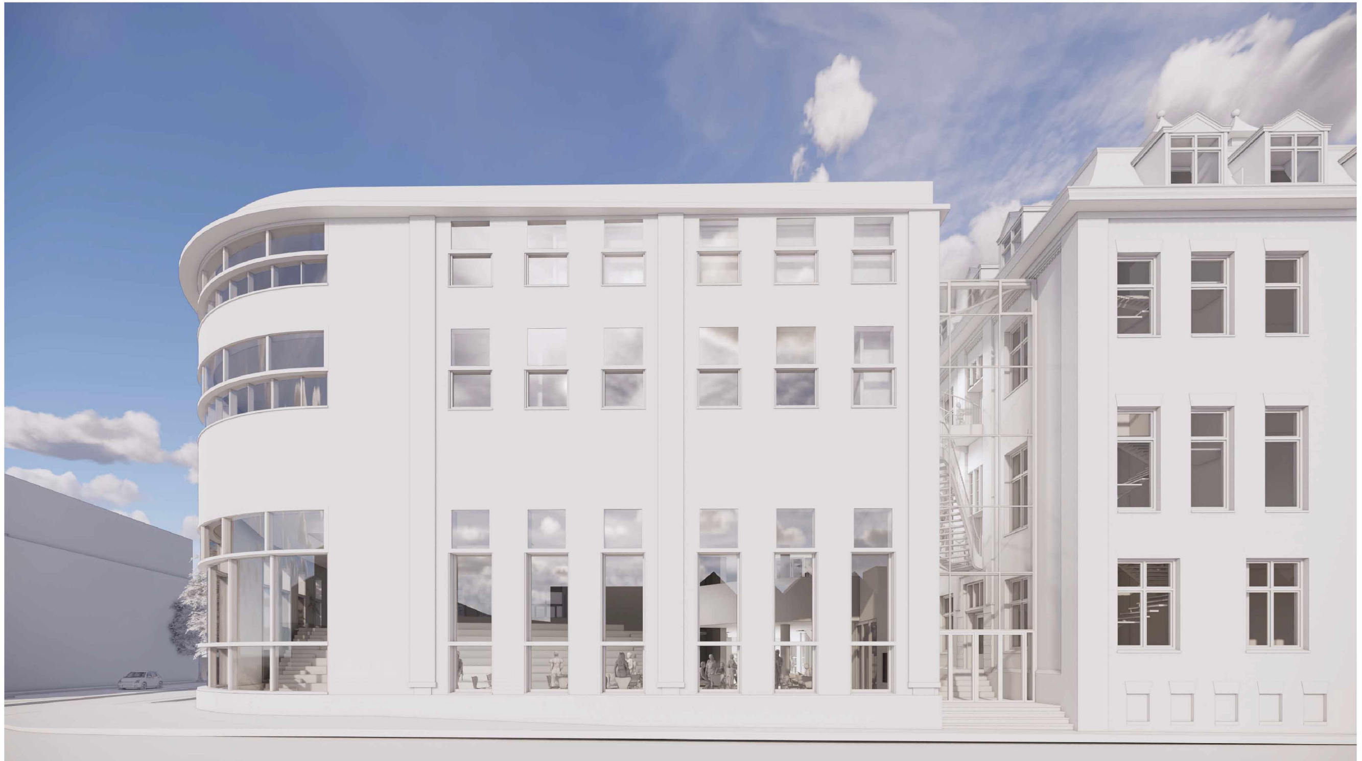
VARIANT 2 RAMEN VOLGENS RITME GEBOUW D