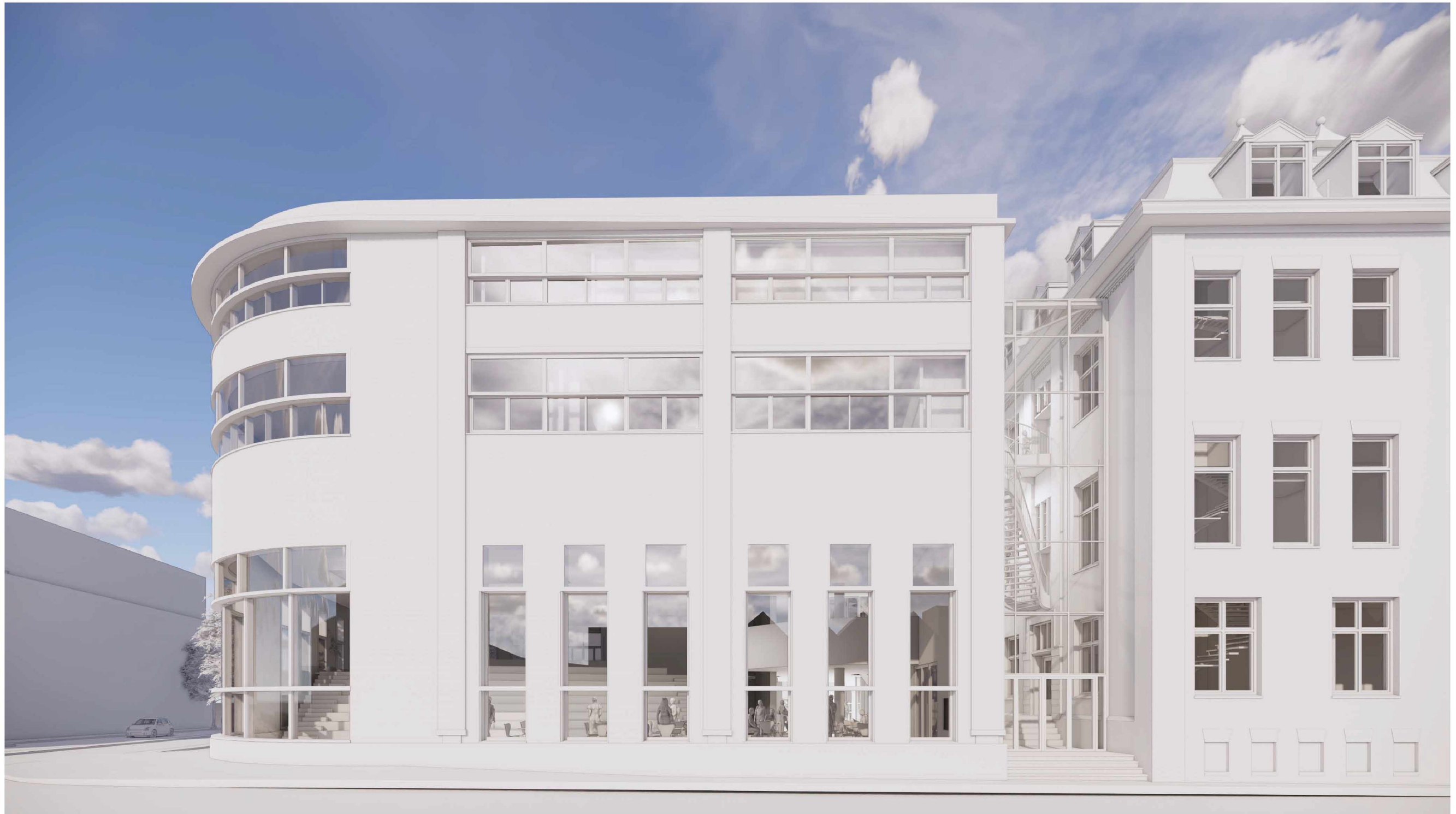
VARIANT 1 RAMEN ALS GEBOUW A