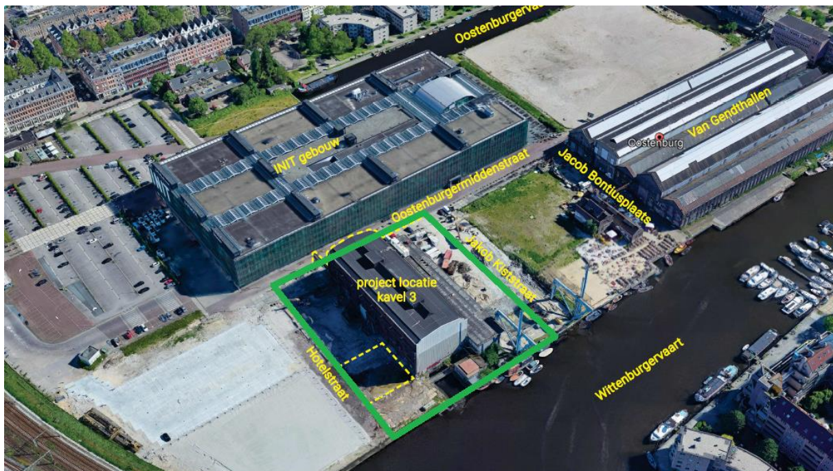
Afb. 3.: Aanduiding ligging Kavel 3 op het Oostenburgereiland (groene lijnmarkering).

U bent voornemens een deel van het Oostenburgereiland (Kavel 3) te ontwikkelen voor woningbouw. In afbeelding 3 is de situering van Kavel 3 op het Oostenburgereiland aangegeven. Ten behoeve van de herontwikkeling worden niet limitatief graafwerkzaamheden in de bodem uitgevoerd (waaronder hert graven van een kelder), worden WKO-filters geplaatst, wordt grond opgebracht en worden funderingspalen in de bodem aangebracht.