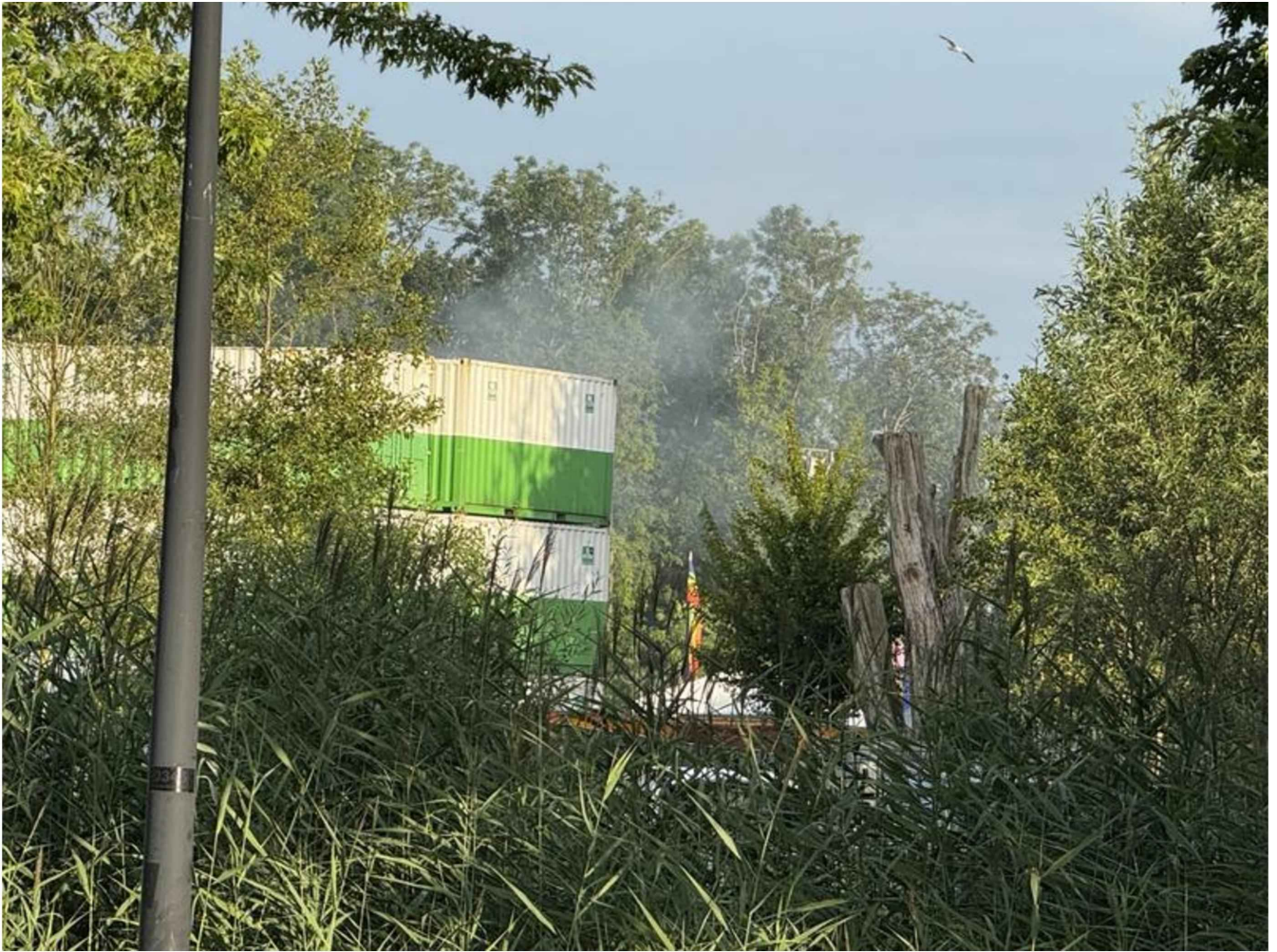
IMG_0607.jpeg op 20-07-2025 20:23 door melder