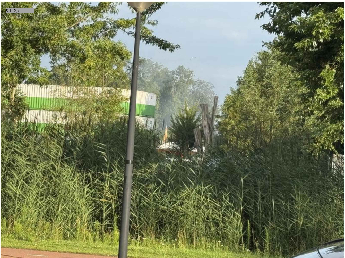
IMG_0606.jpeg op 20-07-2025 20:23 door melder