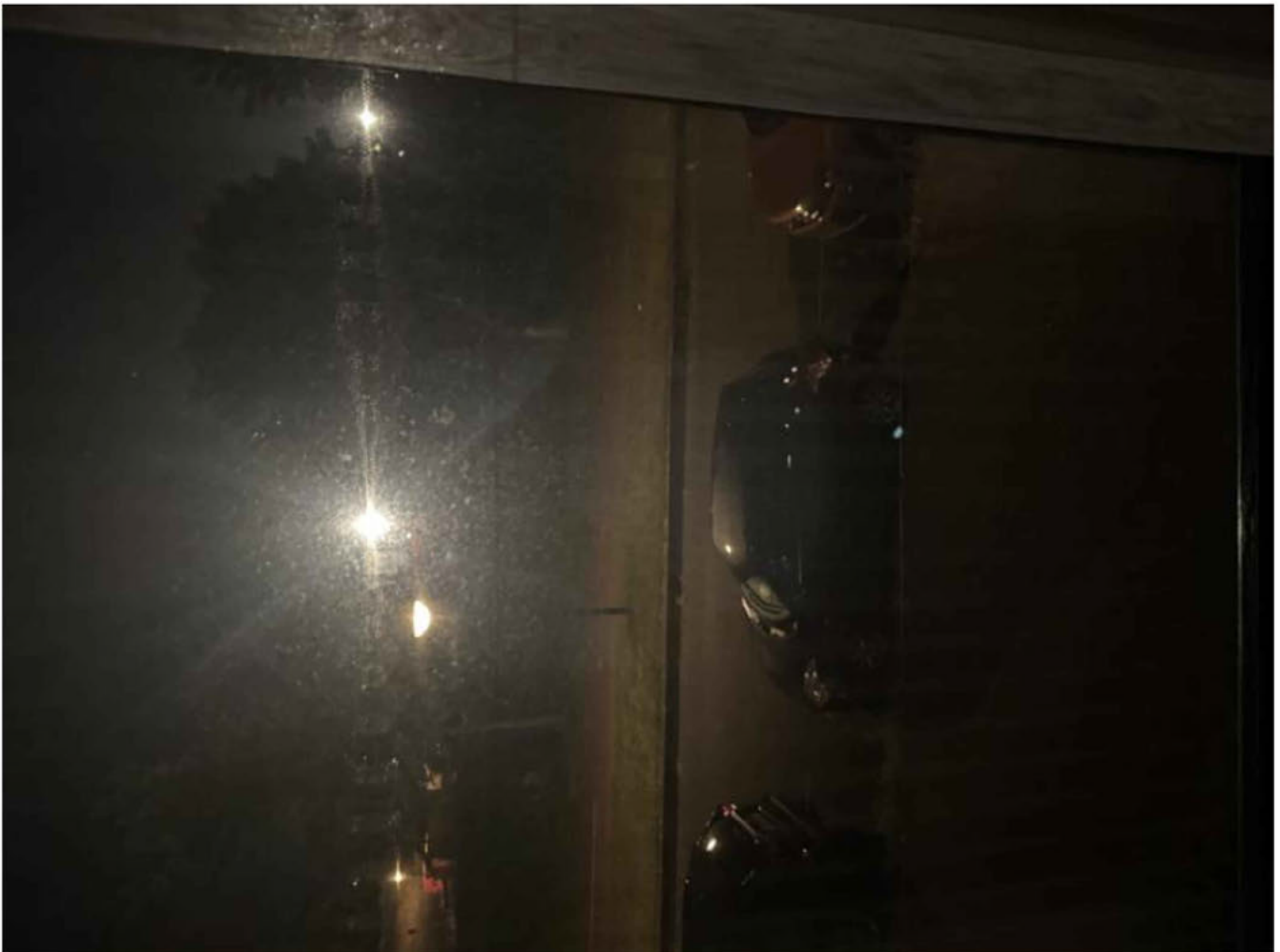
IMG_0561.jpeg op 13-07-2025 01:24 door melder