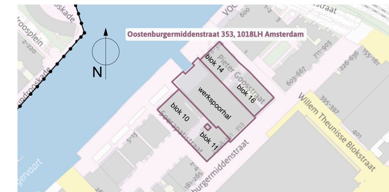
Situatie schaal 1:2000