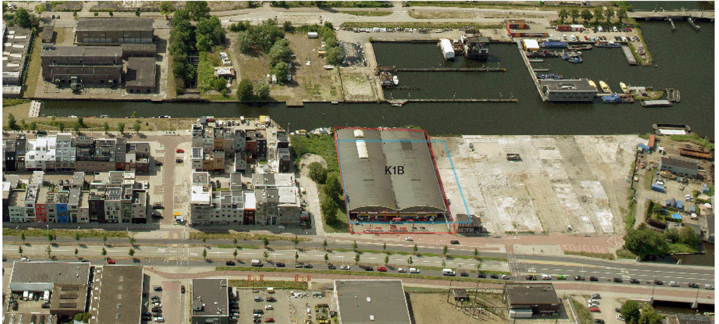
Stedenbouwkundige situatie Bestaande situatie