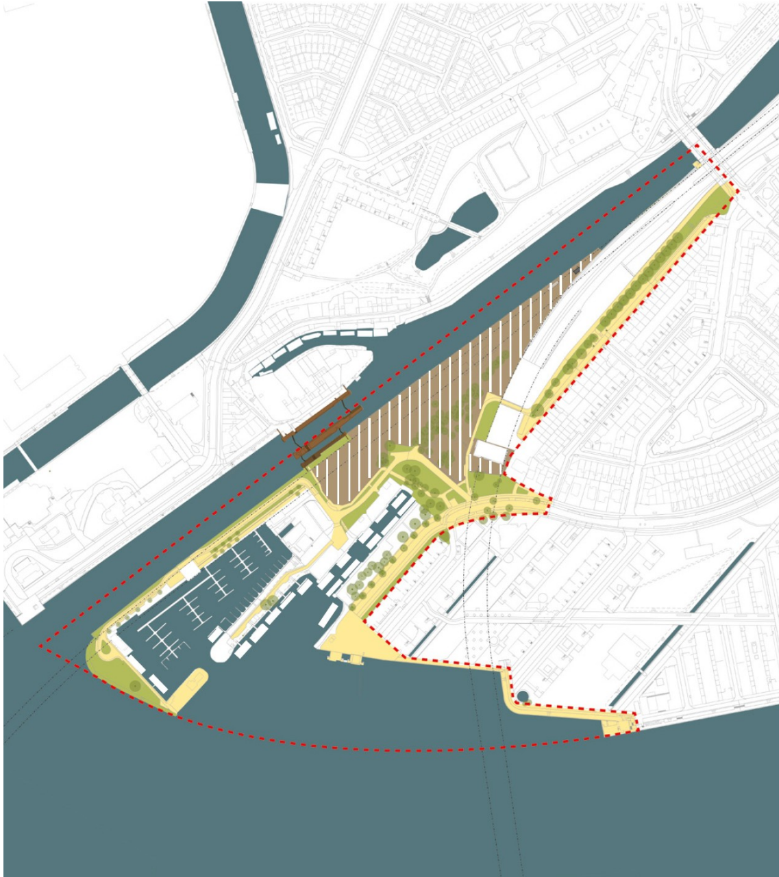
Bestaande situatie Sixhaven - openbare ruimte en werkterreinen NZ-lijn

18/19 december uitnodiging informatieavond en stukken openbaar op site 9 januari informatieavond Sixhaven e.o. 17 januari AB Bestuurscommissie/Stadsdeel Noord Eind januari Staf wethouder Van der Burg Februari Principebesluit B&W, ter informatie naar Commissie RO