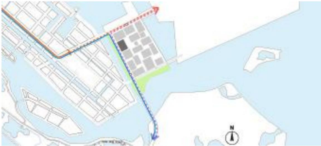
(Toekomstige) connecties van het openbaar vervoer. Blok 4 staat aangegeven in donkergrijs. Tram 26 in rood, busverbinding in blauw.

rijnsnelheid als het aantal parkeerplaatsen op straat is lager dan op de eilanden van de eerste fase van IJburg. De omgeving van de school is volledig autovrij. Zo ontstaat er een voetgangerszone vanaf het plein, langs de school, naar de oostelijke waterwand.