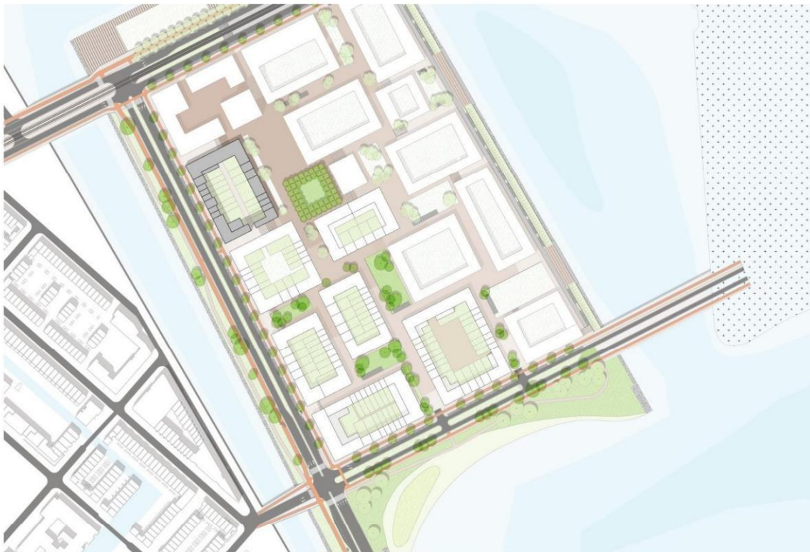
Ligging Blok 4 op Centrumeiland (grijs gearceerd)

Blok 4 is het zevende blok dat wordt uitgegeven en is gelegen in tranche 2 en is gelegen aan de Muiderlaan. In Blok 4 zijn twee kavels bestemd voor twee CPO bouwgroepen. De ene, Kavel 4-01, is gelegen op de kopse kant van Blok 4 en betreft een grote CPO kavel tot maximaal 32 woningen. De andere, Kavel 4-04, is een kleine CPO kavel en is gelegen aan de lange zijde van het blok die aan het centrale plein van Centrumeiland grenst. Deze kavel is geschikt voor maximaal 9 woningen. Het blok bestaat verder uit acht kavels voor Individuele Zelfbouw en vijf kavels voor Samen in het Klein. Verder is er een kleine kavel Medeopdrachtgeverschap (11 tot 14 woningen), deze zal in een aparte selectieprocedure worden aangeboden via TenderNed.