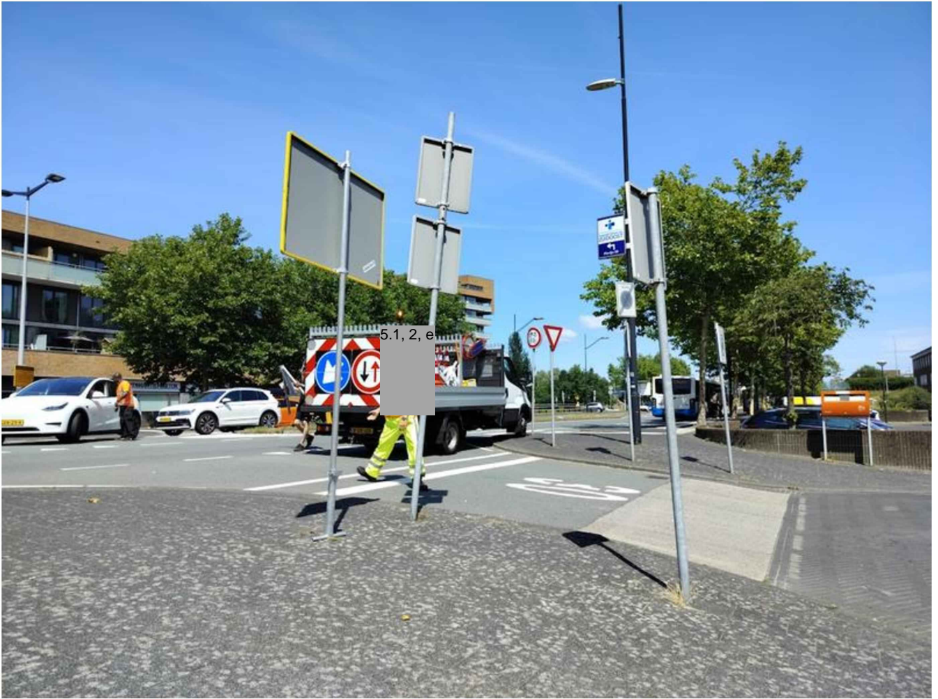
K1c.jpg op 13-07-2025 13:02 door melder