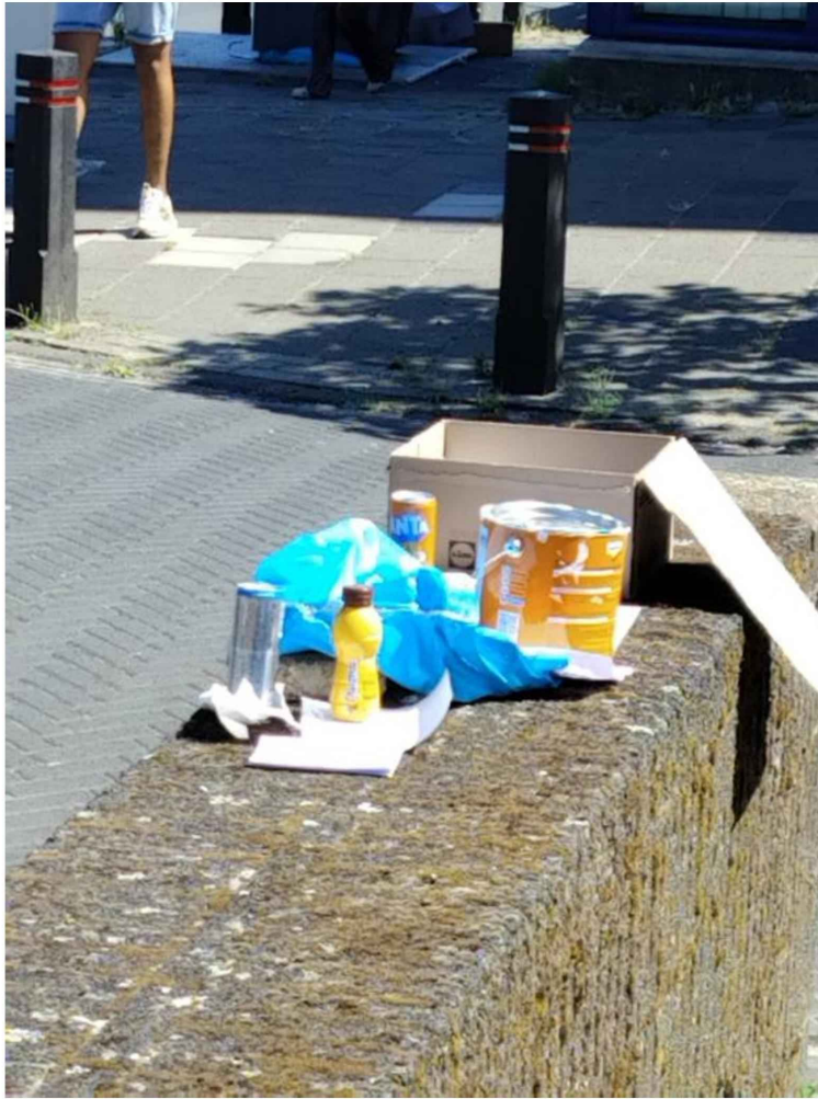
K1d.jpg op 13-07-2025 13:02 door melder