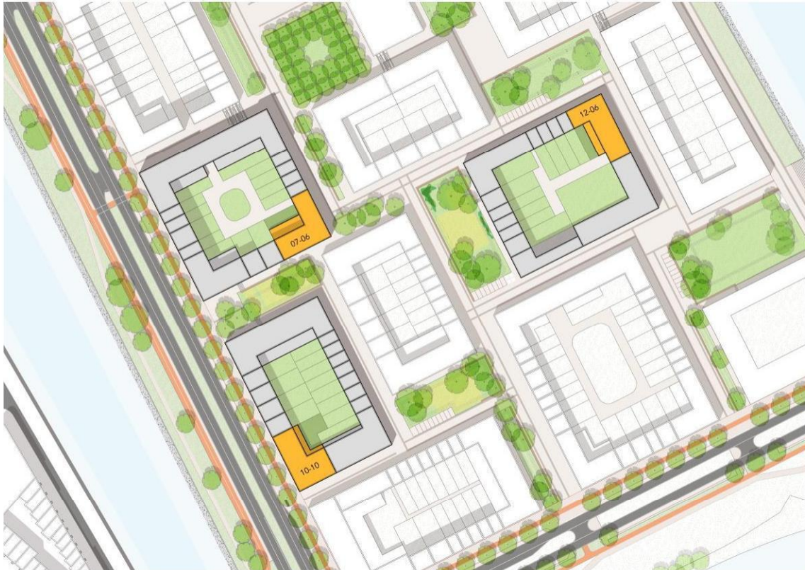
Ligging kavels 07-06, 10-10 en 12-06

Binnen deze selectie zijn er drie opgaven, die bestaan uit de ontwikkeling van drie appartementencomplexen in medeopdrachtgeverschap op verschillende locaties op Centrumeiland, kavel 07-06, kavel 10-10 en 12-06. Het is van belang dat deze drie appartementencomplexen als individuele complexen ontwikkeld worden. Dat betekent dat er uiteindelijk drie bouwgroepen zullen zijn en dat er drie afzonderlijke erfpachtcontracten worden opgesteld. De opgave van de drie appartementencomplexen wordt aan één ontwikkelaar gegund. Er wordt daarom per kavel een optieovereenkomst gesloten, dus in totaal is sprake van 3 optieovereenkomsten. Het is dan ook van belang dat er drie verschillende bouwgroepen met verschillende statuten gevormd worden.