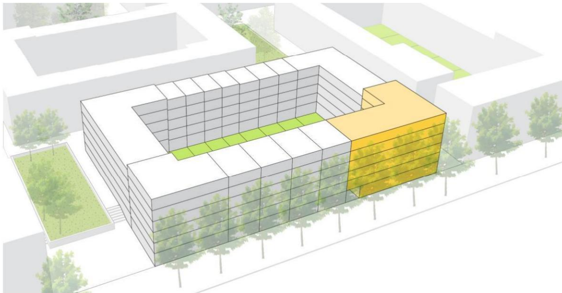
Kavel 10 in blok 10

Kavel 10-10 is gesitueerd in blok 10, ook aan de Muiderlaan. De kavel ligt op de zuidhoek aan de Muiderlaan. Op kavel 10-10 is een appartementencomplex bestaande uit minimaal 10 en maximaal 15 zelfbouwoningen met de erfpachtrechtelijke bestemming 'appartementsrecht meergezinswoningen' voorzien. Daarnaast is er 385 m 2 bestemd voor een niet-woonbestemming.