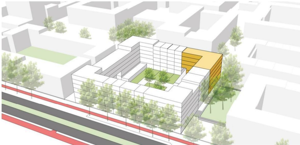
Kavel 6 in blok 7

Kavel 10-10 is gesitueerd in blok 10, ook aan de Muiderlaan. De kavel ligt op de zuidhoek aan de Muiderlaan. Op kavel 10-10 is een appartementencomplex bestaande uit minimaal 10 en maximaal 15 zelfbouwoningen met de erfpachtrechtelijke bestemming 'appartementsrecht meergezinswoningen' voorzien. Daarnaast is er 385 m 2 bestemd voor een niet-woonbestemming.