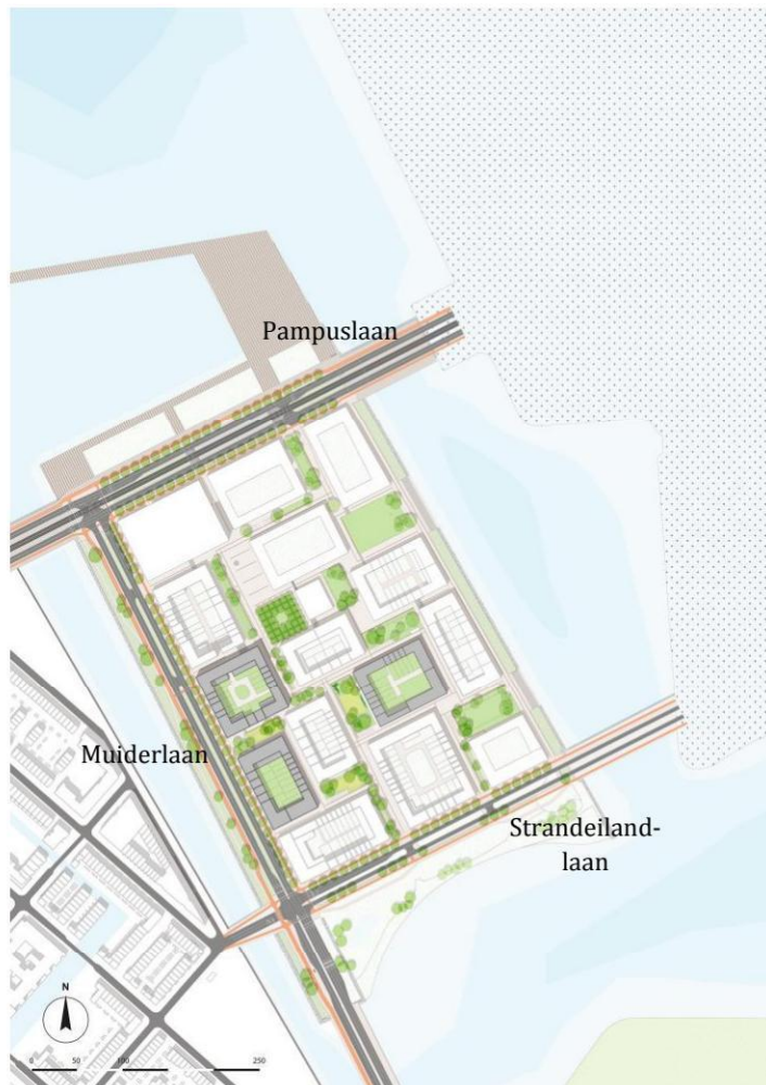
Ligging Blok 7, 10 en 12 op Centrumeiland

Een goede bereikbaarheid met openbaar vervoer is bij een autoluwe wijk belangrijk. Er is een reservering voor een halte van de IJtram, tram 26, bij de ontsluiting op de Pampuslaan. De lijn zal doorgetrokken worden vanaf het Haveneiland afhankelijk van de voortgang van de ontwikkeling op het toekomstige Strandeiland. Naar verwachting zal dit in elk geval tot en met 2024 duren. Op de Pampuslaan ligt de reservering voor een tweede en derde hoogwaardige OV-lijn tussen Zuidoost en Strandeiland en tussen Weesp en Strandeiland. Een tijdelijke OV-verbinding tussen Weesp en Centrumeiland zal gaan rijden vanaf 2021 of 2022. Tot die tijd is buslijn 66 (richting Zuidoost) met een halte op de Muiderlaan de enige OV-lijn.