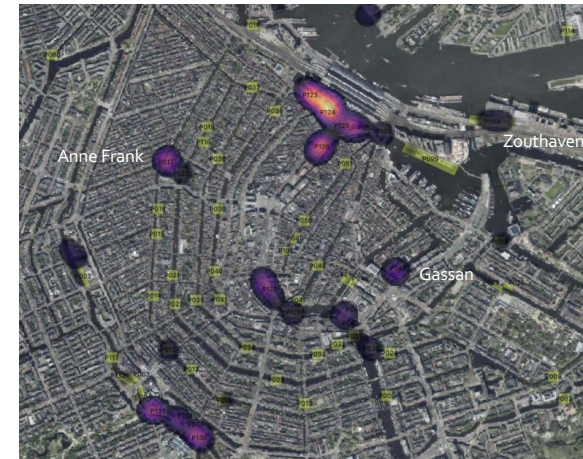
Heatmap aantal stops rondvaartboten