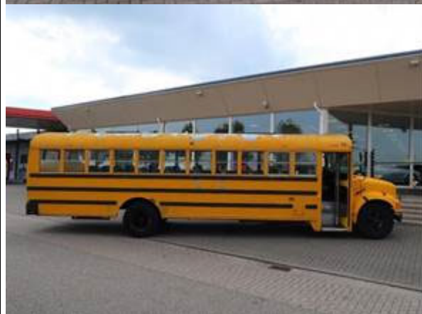
Voorbeeld van de verkoopunit.