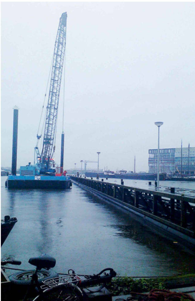
Aanleg drijvende steiger in Oude Houthaven