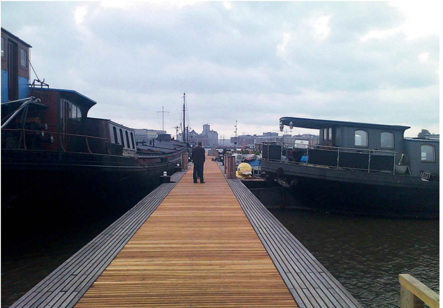
Haparandasteiger in gebruik