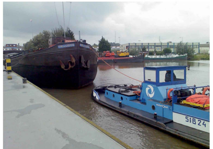
De Trijoco gaat vertrekken