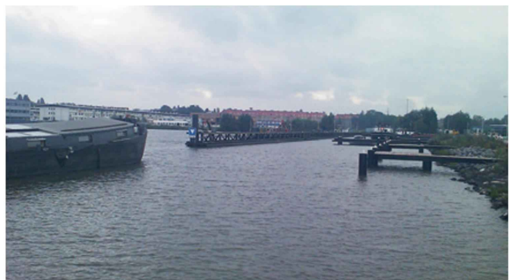
Gevlewegsteiger is leeg