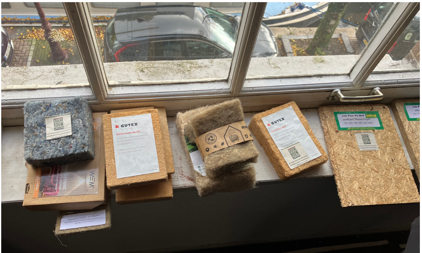
Voorbeelden van biobased isolatiemateriaal

Biobased en circulair zijn de standaard bij verbouwingen en transformaties. Behoud is de meest duurzame keuze, verduurzaming van monumenten met biobased materialen is uitgangspunt.