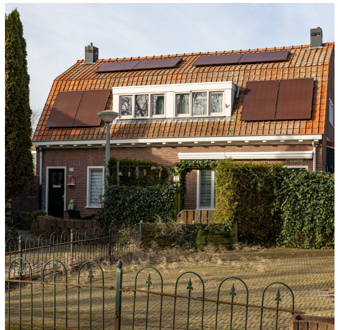
Voorbeelden van zonnepanelen in rijksbeschermd stadsgezicht in Amsterdam Noord