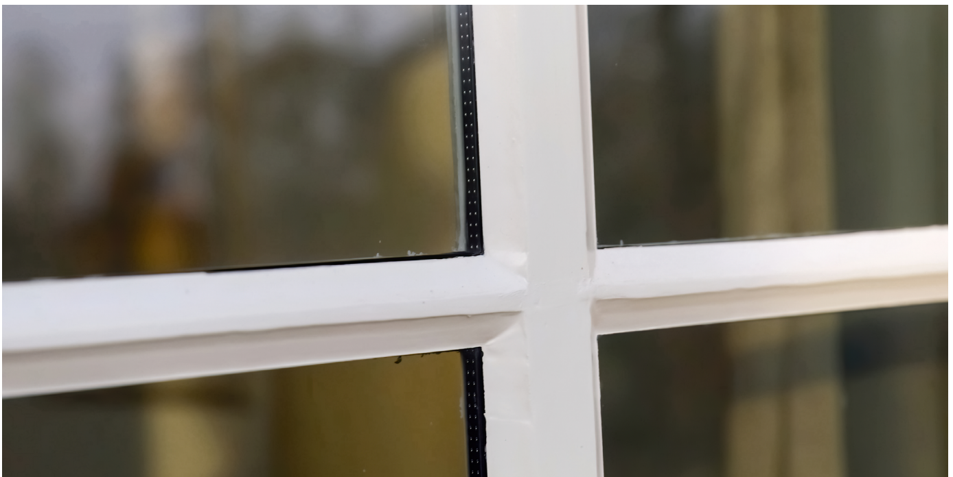
Voorbeeld van isolerend monumentenglas (foto: RCE)

Met uitvoeringsstandaarden en voorbeeldboeken is isolatie (ramen, gevel, dak) vergunningsvrij of is een vereenvoudigde vergunningsprocedure van kracht.