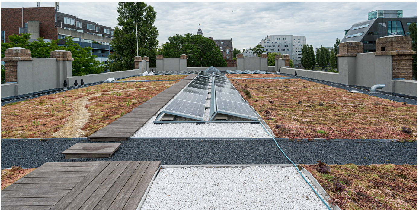
Het eerste slimme blauw-groene dak ligt op een Rijksmonument, Loydhotel, Oostelijke Handelskade 12

Voor alle gebouwen met platte daken, inclusief de monumenten, is duidelijk op welke wijze dakvergroening mogelijk is. Voor gevelgroen zijn er heldere uitvoeringsstandaarden.