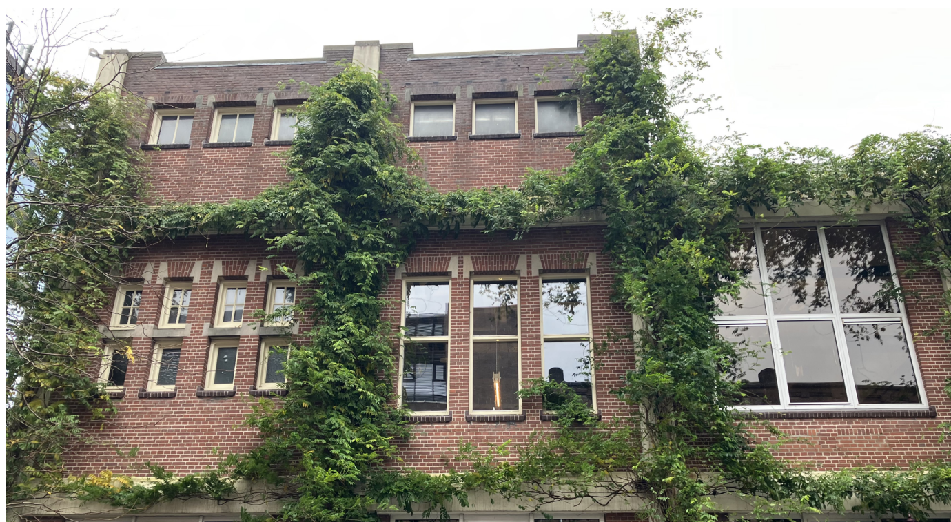
Voorbeeld gevelvergroening Voormalige Stadstimmertuin (Centrum)