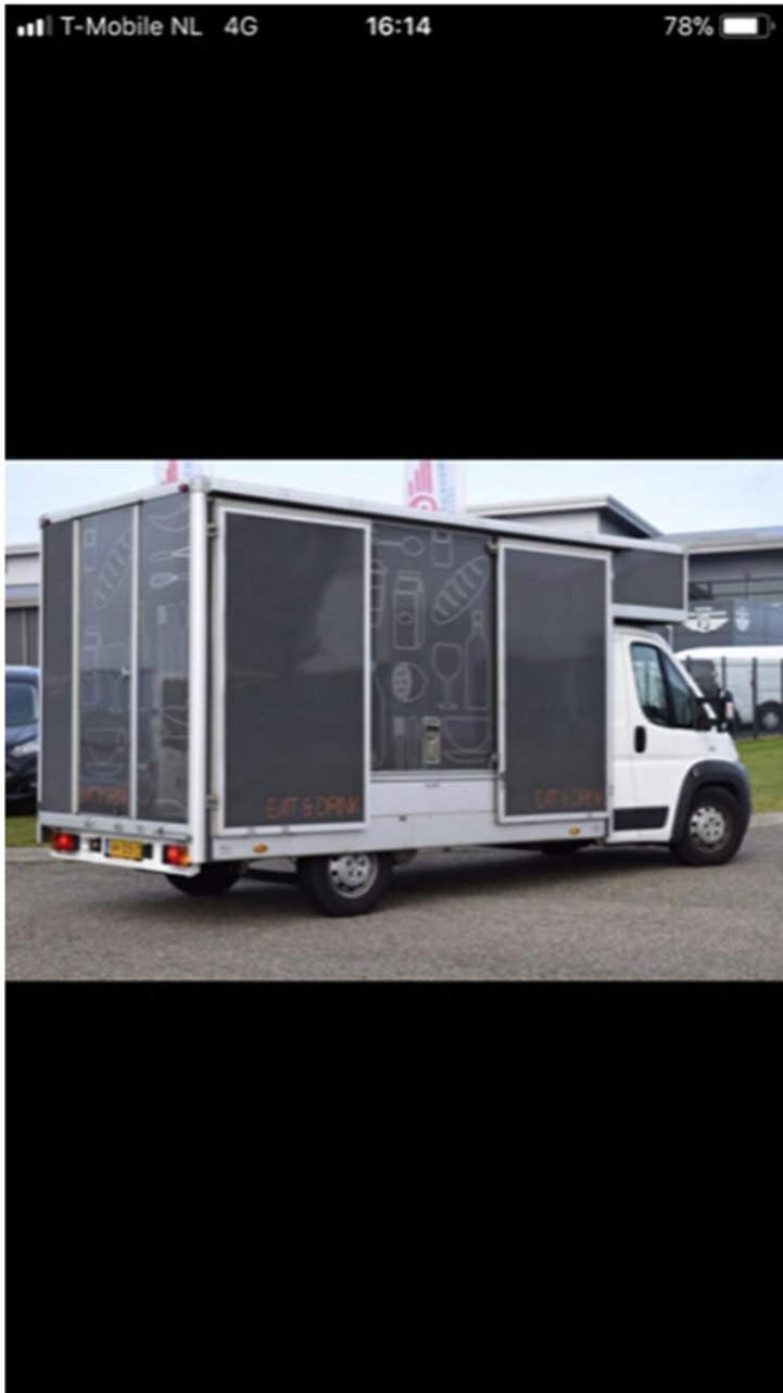
7.permanent of mobiel. De Foodtruck van Baba grilled chicken zal mobiel worden opgesteld. Deze wordt s avonds weggehaald.