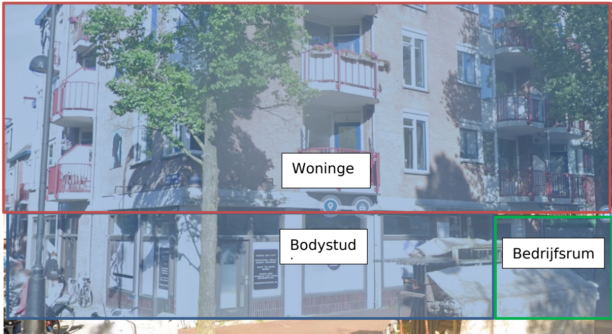
Figuur 1 Situatie gezien vanaf de straatzijde.