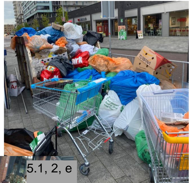
Festibins Afzetcontainers evt gebruik van veel tape