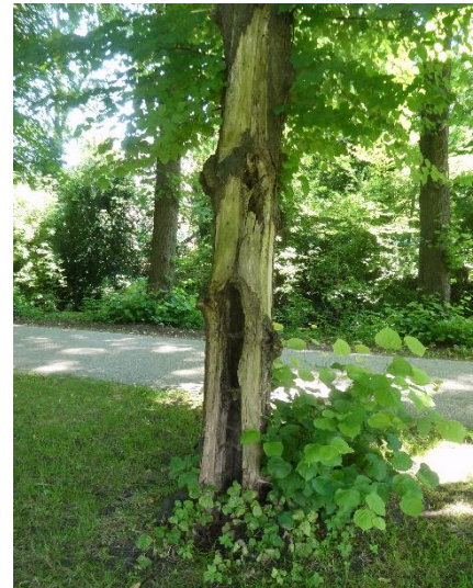
stam linde 406733 op 24-6-2024

Linde 460733 uit 1870 staat niet scheef aan de slootkant, maar begint intussen wel de kenmerken van een veterane boom te vertonen. Het bovenste deel is afgestorven en er is een secundaire kroon gevormd. Bovendien zit in de stam een aanzienlijke holte. Door deze groter wordende holte neemt de kans op stambreuk toe. Stambreuk is niet alleen een veiligheidsrisico, maar zal tevens leiden tot verlies van het stambeeld in de laan.