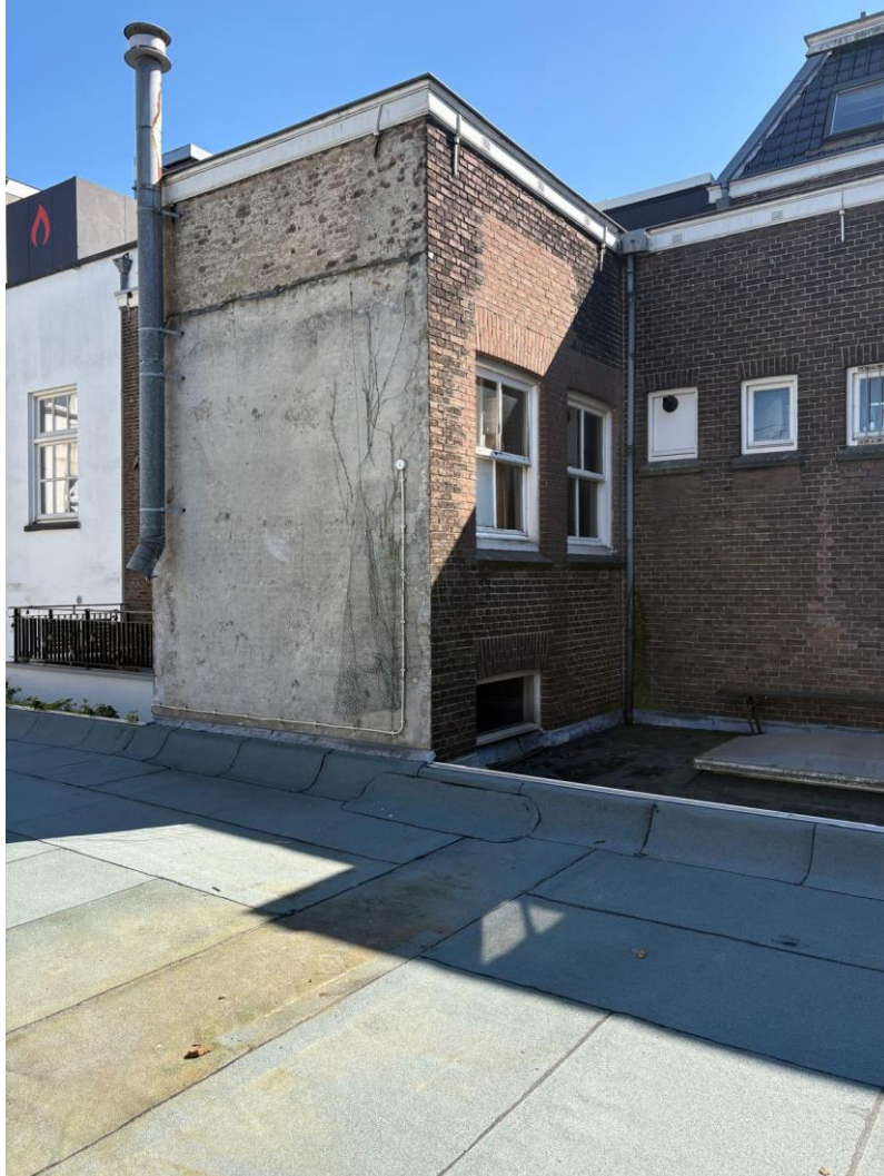
Bestaande kanalen achtergevel