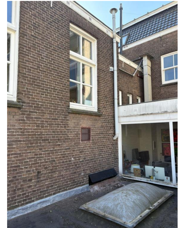
Nieuwe kanalen (minder) en positie GEVELROOSTER TBV IMPANDIGE GEPLAATSTE LBK