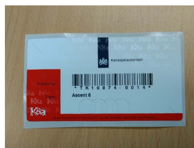
Voorbeeld van een Ksa-merkteken

Speelautomaten in speelautomatenhallen kunnen meerdere spelersplaatsen hebben. Elke spelersplaats heeft een eigen merkteken. Het aantal spelersplaatsen kan worden geteld door het aantal merktekens op te tellen. Het aantal zitplaatsen moet hiermee overeenkomen. Het aantal speelautomaten kunnen worden geteld door het aantal merktekens te tellen met een unieke waarde. Hieronder staat een voorbeeld beschreven: