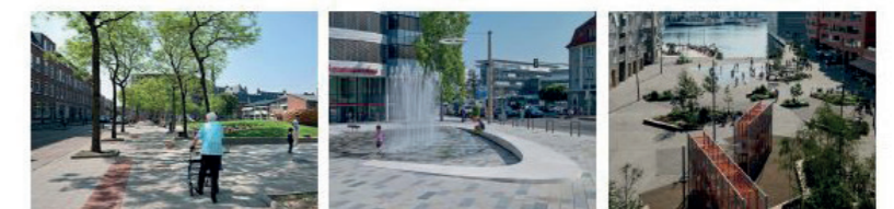
Bron: De Werff Architectuur