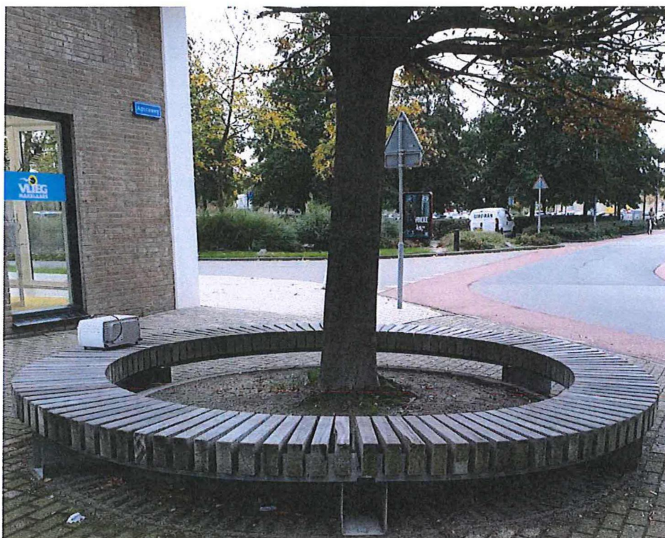
Voorbeeld van een houten boombank

De voorkeur verdient echter een opwaardering van de begraafplaats als geheel waardoor de relatie treures en locatie beter tot uiting komt. Om daarbij de waarde van boom en locatie te benadrukken kan daarbij gedacht worden aan een informatiebord over de bijzonderheid van de boom in combinatie met de omgeving en de historie van deze bijzondere plek.