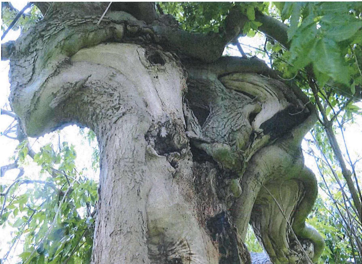
Detail van bovenkant stamwond onderaan de kroon