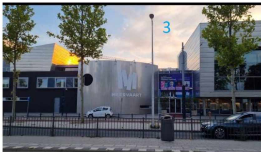
3. Huidige locatie De Meervaart