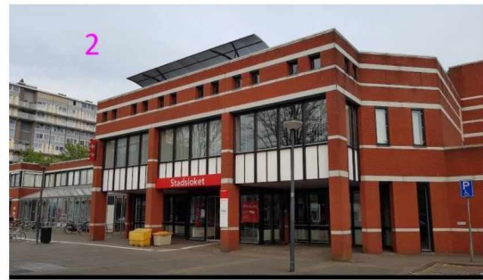
2. Huidige locatie Stadsdeelkantoor