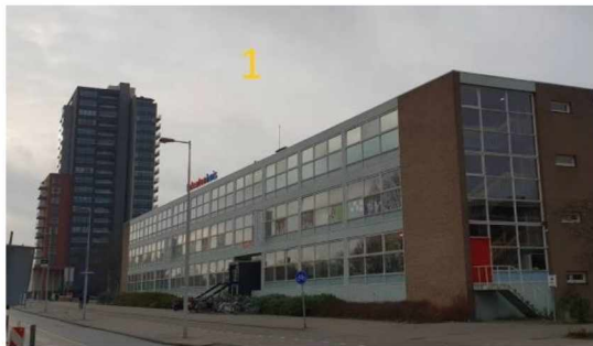
1. Huidige locatie Talentschool

Voorstel Locatiewissel: 1. De nieuwe Meervaart, 2. De nieuwe Talentschool, 3. Het nieuwe Stadsdeelkantoor