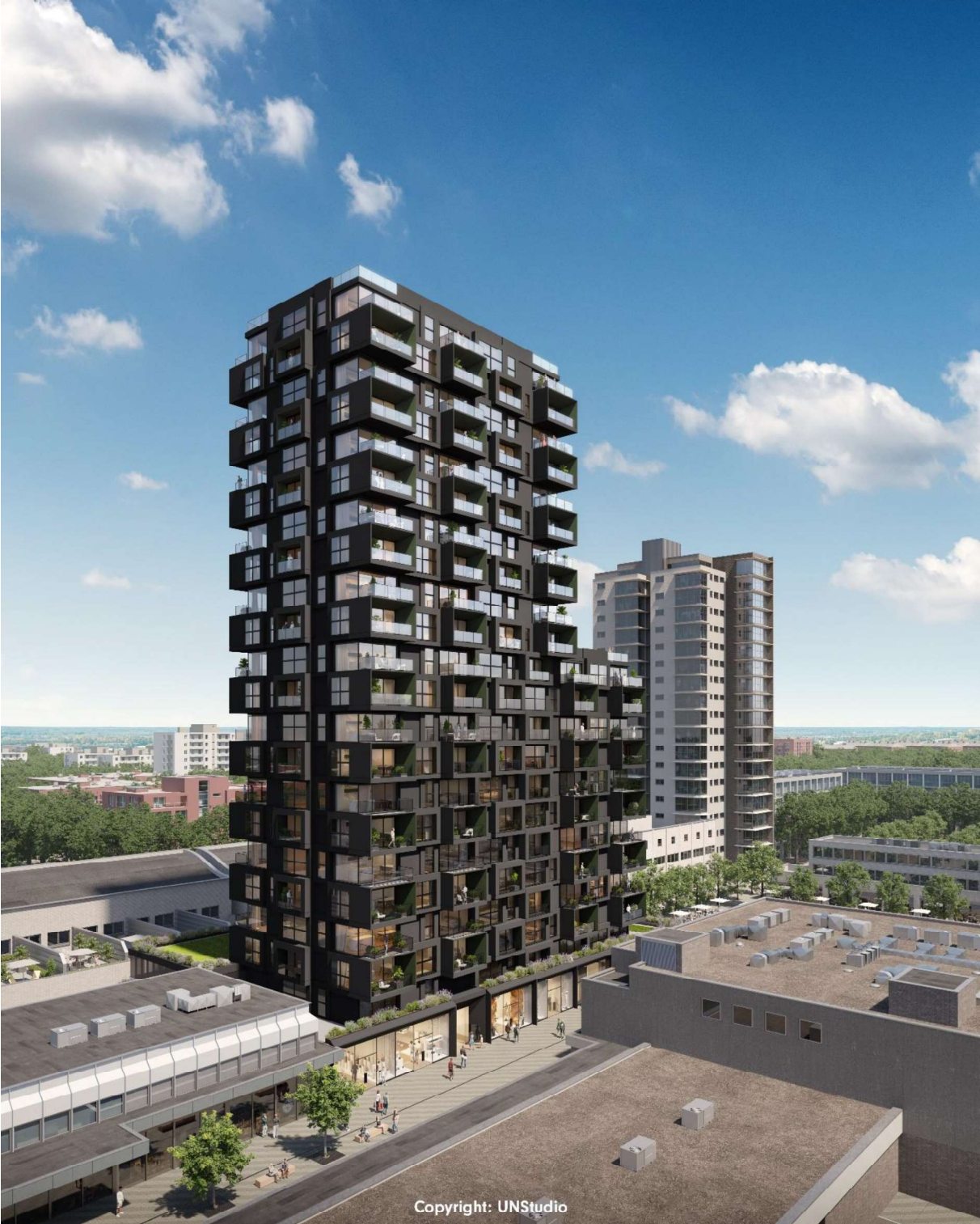
Plot/Beeld 1: 1390 m2 winkelruimte en daarboven 145 appartementen. Ontwerp UNStudio