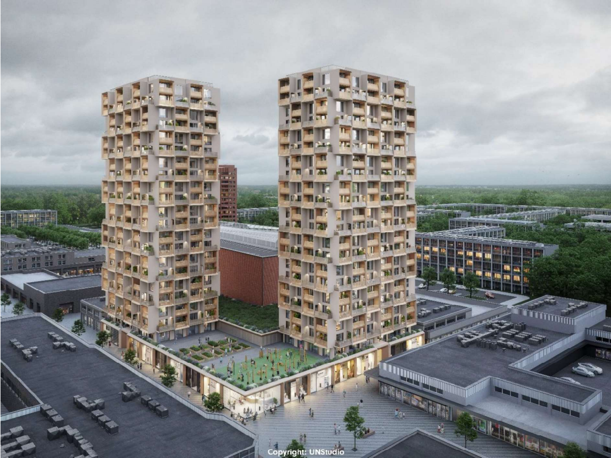
Plot/beeld 3: 1932 m2 winkelruimte en 244 appartementen. Ontwerp UNStudio