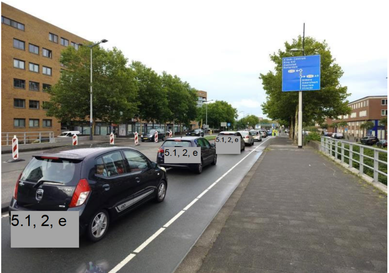
Bijlmerreef200725.jpg op 20-07-2025 19:19 door melder