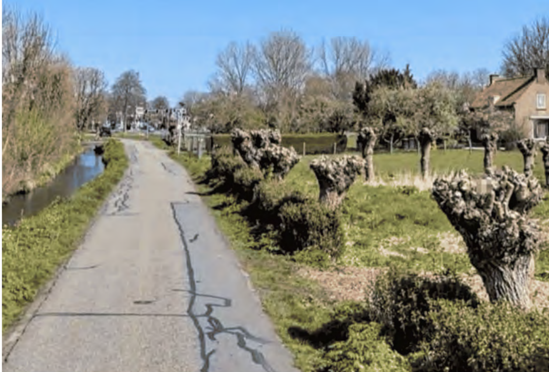
AETSVELDSEWEG AUTHENTIEKE BOOMGAARD MET WILGEN