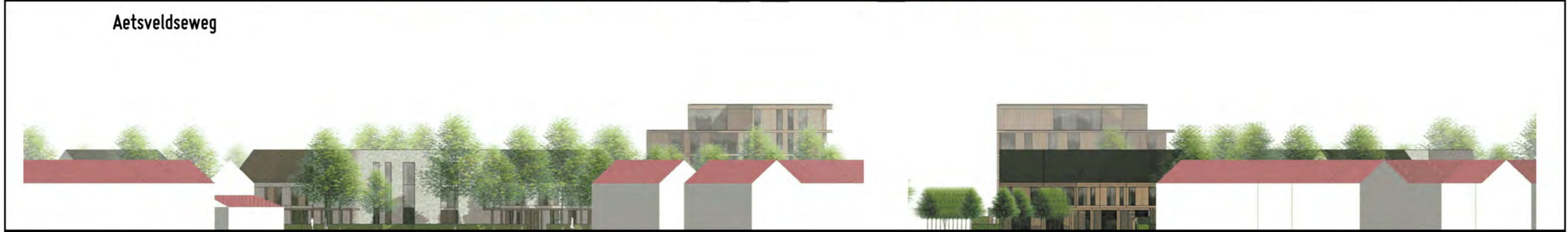
G.J. Wiefferingdreef / Waardijkstraat